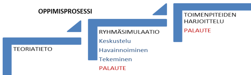
KUVIO 6. Oppimisprosessi, harjoittava opetusmenetelmä.

Tehokas ja hyödyttävä harjoittelutilanne edellyttää koulutettavan riittävää teoriatiedon hallintaa sekä aidon tuntuista harjoitteluympäristöä, jossa oppimisprosessi voi edetä vaiheittain, kuten kuviossa 6 on esitetty. Menetelmän tehokkuus perustuu teoreettisen tiedon, mallioppimisen ja motorisen toiminnan yhdistymiseen totuuden mukaisessa tilanteessa. (Alaspää 2003, 542)