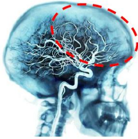
KUVIO 1. Aivojen etuosan verenkierto (ks. alkuperäinen kuvio: Sand ym. 2011, 133.)

on esitetty kuviossa 1. Oireina on tyypillisesti infarktialueen vastakkaisen puolen raajojen heikkous, infarktin puoleinen kasvohalvaus/tuntopuutoksia, puhehäiriötä ja näkökenttäpuutoksia. Puhehäiriöön liittyy usein kirjoitus, laskemis- ja lukemishäiriöitä. Oirekuva vaihtelee jonkin verran. Joskus oikean aivopuoliskon infarktiin liittyy sairauden tunnon puute. Laajassa infarktissa silmät devioivat infarktin puolelle eli ”katsovat vaurioon päin”). (Soinila ym. 2007, 298; Kunnamo ym. 2006, 1257.)