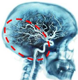
KUVIO 2. Aivojen takaosan verenkierto (ks. alkuperäinen kuvio: Sand ym. 2011, 133.)

Aivojen takaverenkierrosta vastaavat nikamavaltimot, jotka yhtyvät kallonpohjavaltimeiksi. Kallonpohjavaltimo yhdistyy aivojen valtimokehälle, josta haarautuvat takimmaisat aivovaltimot. Aivojen takaverenkierrosta vastaa aivojen takaraivolahkon lisäksi aivorungon ja pikkuaivojen verenkierrosta. Takaosan verenkierron alue on esitetty kuviossa 2.