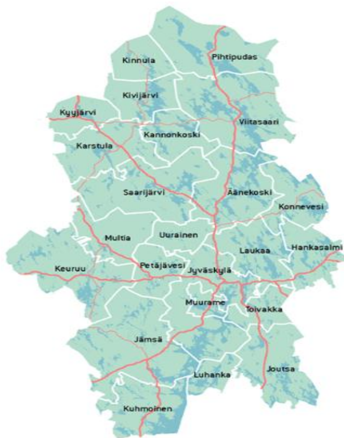
KUVIO 3. Keski-Suomen sairaanhoitopiirin alue. Jämsä ja Kuhmoinen siirtyvät Pirkanmaan sairaanhoitopiiriin vuoden 2013 alussa.

Keski-Suomen sairaanhoitopiiriin kuuluu 23 kuntaa (kuvio 3). Sairaanhoitopiirin alueella oli vuoden 2011 loppuun mennessä 274 379 asukasta. Keski-Suomen sairaanhoitopiiri järjestää erikoissairaanhoidon yhdessä Kuopion Yliopistollisen sairaalan kanssa, jossa leikataan pääsääntöisesti aivokirurgiset potilaat.