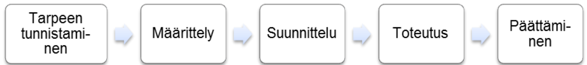
KUVIO 4. Projektin vaiheet.