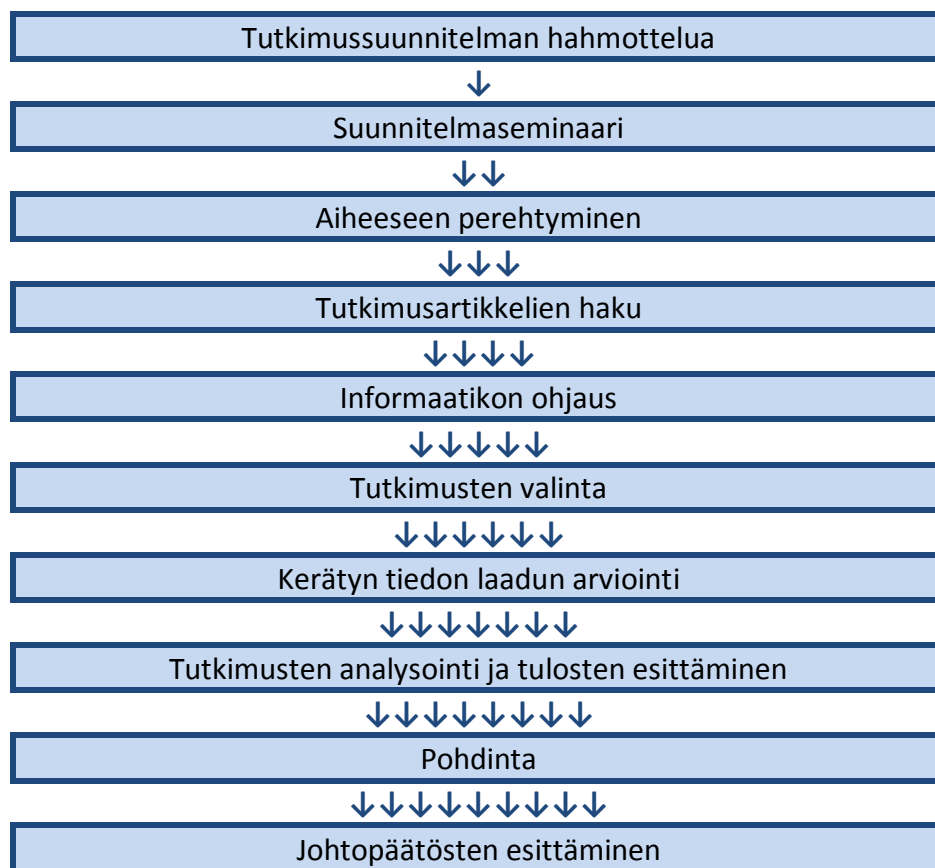
KUVIO 1. Kirjallisuuskatsauksen vaiheet

Opinnäytetyössäni kuvaan psykoedukaation menetelmiä mielenterveystyössä. Tutkimusaineistoni koostuu Chinal tietokannasta valituista tutkimuksista. Valitsemieni tutkimusten kohteena olivat mielenterveysongelmaiset potilaat ja heidän kokemuksensa psykoedukaation menetelmistä. Aineiston analysoin teemoittelulla, joten laadullinen tutkimusote on perustelu.