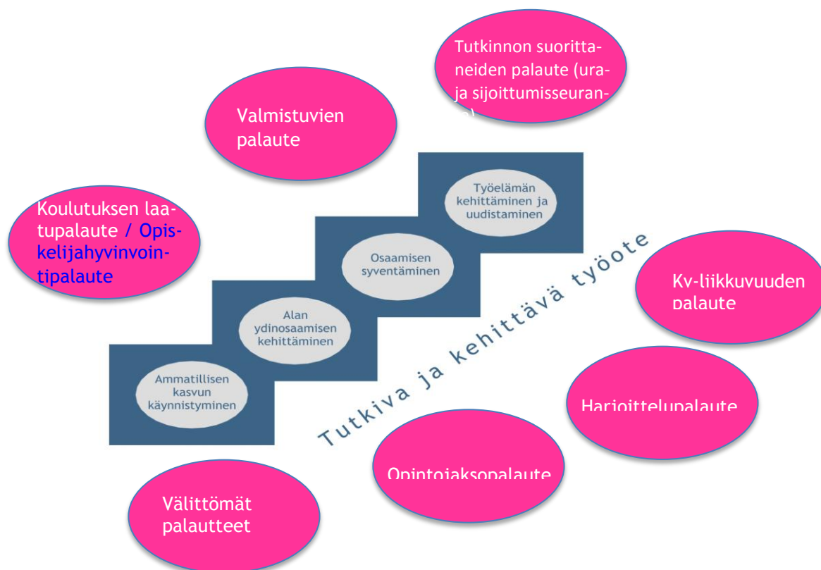
Kuvio 1: Laurean opiskelijapalautejärjestelmä ja palautteen keräämisvaiheet

Opiskelijapalautejärjestelmä koostuu monesta eri osatekiästä. Palautetta kerätään opiskelijoilta vuorovuosin Opiskelija hyvinvointi -kyselyn ja Koulutuksen laatu -kyselyn muodossa. Lisäksi palautetta pyydetään valmistuvilta ja tutkinnon suorittaneilta opiskelijoilta. Opiskelijoilla on mahdollista antaa palautetta myös suoraan opettajille välittömänä palautteena tai opintojakson jälkeen kerättävien opintojaksopalautteiden muodossa. Jokaisen harjoittelujakson jälkeen käytävissä harjoittelupalautteessa käydään läpi harjoittelujaksolle liittyvää palautetta. Myös kansainväliseen opiskelijavaihtoon osallistuneet opiskelijat antavat palautetta kokemuksistaan. Tämän koko opiskelun läpi jatkuvan palautejärjestelmän tarkoitus on kehittää opiskelijan taitoja ja työotetta.