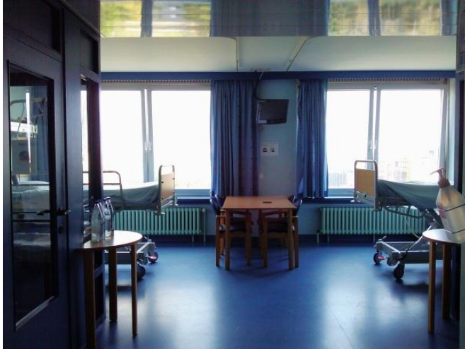
KUVA 3. Potilashuone lapsivuodeosastolla.

Oman lisänsä seksuaaliterveden edistämiseen Belgiassa tuo korkea maahanmuuttajien määrä. Asiakkaista suuri osa puhuu jotakin muuta kieltä kuin flaamia ja henkilökunta joutuu antamaan ohjausta usealla eri kielellä. Kulttuuri ja kieli vaikuttavat siihen, millaista ohjausta kättilö ja lääkäri pystyvät seksuaaliterveydestä antamaan. Jos yhteistä kieltä ei ole, ohjaus jää luonnollisesti vähäisemmäksi. Henkilökunnan tulee myös olla perillä eri kulttuurien tavoista, jotta he pystyvät antamaan ohjausta kulttuuriin sopivalla tavalla. Toisesta tutkimuksen sairaalasta, synnytyssalin kansliasta löytyi flaaminkielistä tietoa ympärileikatuista naisista. Kättilöltä tiedusteltaessa nämä naiset eivät ole kovin yleinen asiakasryhmä vaan heitä tulee synnyttämään hyvin harvoin. Eräs kättilö oli keskipitkän uransa aikana hoitanut vain muutamaa ympärileikattua naista.