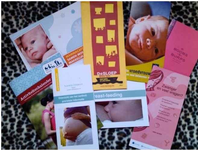
KUVA 5. Lapsivuodeosastolla tarjolla olevia esitteitä.

keskitytään myös sairaalassa tapahtuviin käytäntöihin. Viimeisellä valmennuskerralla tehdään myös synnytyssuunnitelma.