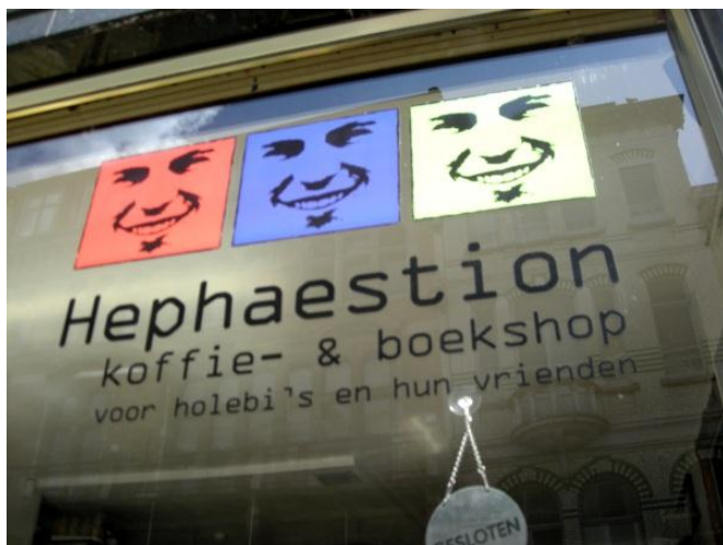
KUVA 1. Hephaestion – kahvila ja kirjakauppa homoille ja heidän ystävilleen.

Raskaana olevia on katukuvassa paljon, mutta lapsia on kaupungissa vähemmän. On mahdollista, että lapsiperheet muuttavat pian kauemmas kaupungin keskustasta lapsen saamisen jälkeen. Yksi- ja kaksilapsisia perheitä näyky kaupunkikuvassa enemmän kuin suurempia. Imettäminen on julkisilla paikoilla luultavasti hyväksyttyä, koska sitä näkyy silloin tällöin katukuvassa.