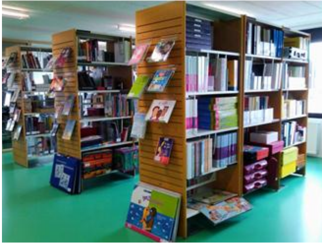
KUVA 6. Seksuaaliterveyden edistämiseen tarkoitettu lainattava materiaali Sensoan toimistolla Antwerpenissä.

Sensoan yksi tärkeimmistä tehtävistä on auttaa kouluja järjestämään hyvää seksuaalikasvatusta. Sensoa jakaa ja lainaa materiaalia, tehtäviä ja pelejä opetuksen tueksi. Heiltä opettajat saavat lainata muun muassa PC-pelejä, korttipelejä, esitteitä, elokuvia ja kirjoja sekä ehkäisy pakkeja simulaatioita varten. Sensoa on myös kehittänyt erityisiä kansioita eri ikäisille nuorille, joissa on muun muassa tietoa ja tehtäviä koskien seksuaali-asioita. Kansio on tarkoitettu opettajien tueksi oppitunneille. Kansiot alkavat jopa kolmen vuoden iästä ylöspäin ja ne on suunniteltu yhteistyössä vanhempien, nuorten ja ammattilaisten kanssa. Sensoa tarjoaa koulutusta opettajille sekä alan muille ammattilaisille. Tarjolla on opettajille vuoden ympäri pyöriviä koulutuksia sekä kouluilla että Sensoan omalla toimistolla koskien seksuaaliterveyttä.