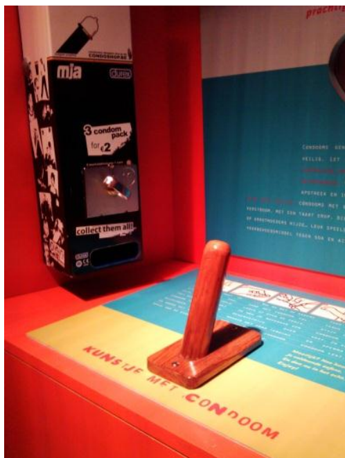
KUVA 8. De wereld van Kina -museon näyttely nuorille seksuaaliterveydestä 'Goede Minnaars'.

monipuolinen ja mukavalla tavalla rakennettu. Se edistää seksuaaliterveyttä kauniilla tavalla. Museo on auki päivittäin kello 9–17 ja sisäänpääsymaksu museoon on 0,50e.