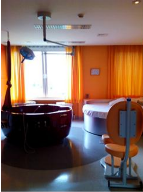
KUVA 4. Vesisynnytykseen tarkoitettu huone synnytysosastolla.

Vaikka imetysohjaus Belgiassa on laadukasta ja toinen tämän tutkimuksen sairaaloista oli ansainnut Maailman terveysjärjestön ja Unicefin myöntämän Vauvamyönteisyysdiplomin, eivät kätilöt tunteneet niin kutsuttua hands off -tekniikkaa imetysohjauksessa. Kätilöt käyttivät rohkeasti omia käsiään auttaesaan vauvaa rinnalle ja ohjasivat äitiä sanallisesti ja itse näyttäen. Naisilta ei kysytty lupaa, saako heidän rintoihinsa koskea. Tämä voi loukata joidenkin yksilöiden koskemattomuutta ja siten aiheuttaa hallaa seksuaaliterveydelle. Myös potilashuoneisiin koputtaminen usein unohdettiin ja joskus ovia jätettiin auki. Tämä saattoi loukata naisten yksityisyyttä ja seksuaalisuutta, koska usein huoneessa tehtävät toimenpiteet sijoittuivat naisten intiimeille alueille. Kätilöillä on myös Belgiassa korkea auktoriteetti. Äidit kuuntelevat kätilöiden ohjeita tarkasti ja harvoin sanovat vastaan. Tämän vuoksi olisi erityisen tärkeää kysyä äitien mielipidettä ja antaa heille mahdollisuus vaikuttaa, koska he eivät itse osaa sitä pyytää.