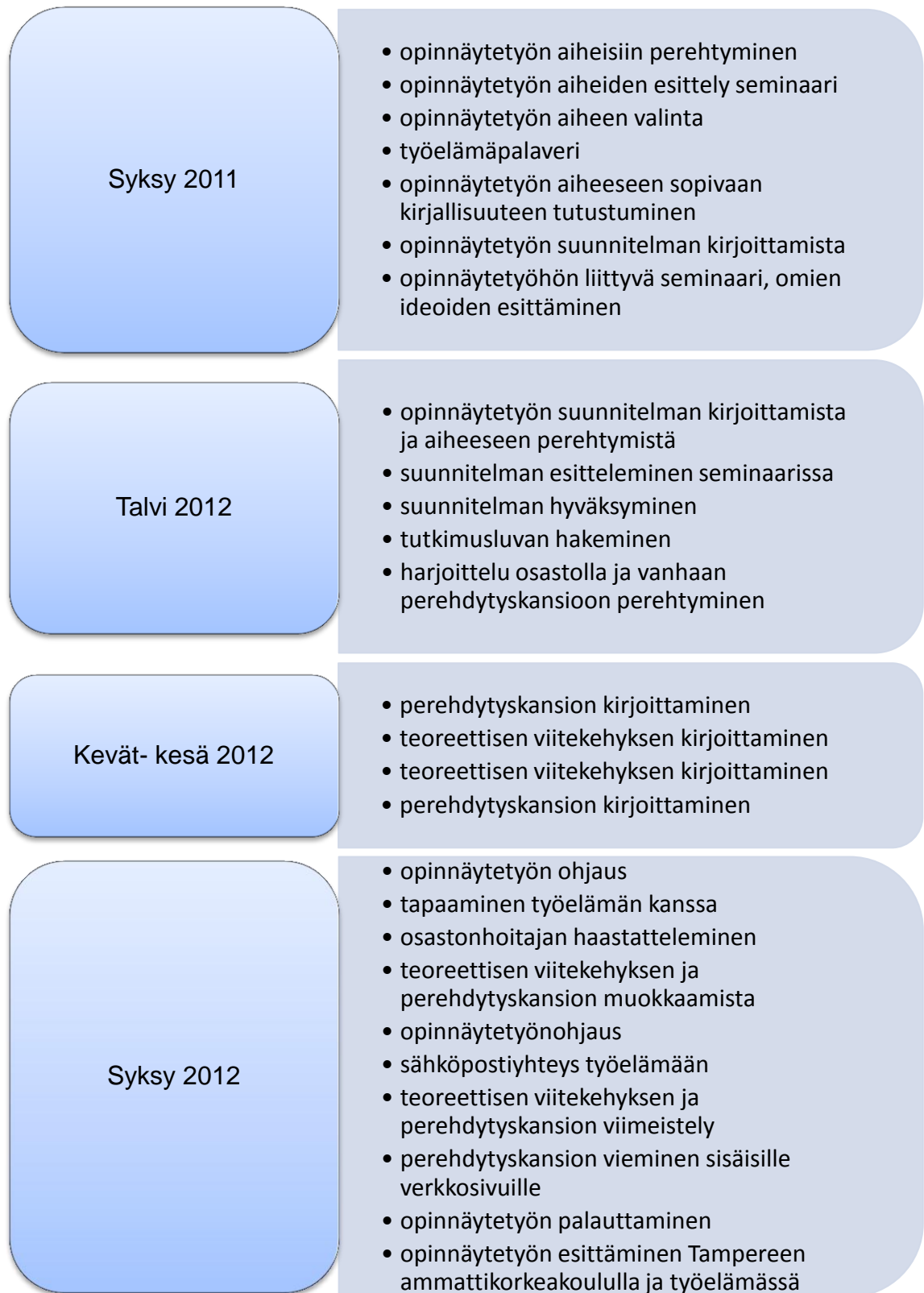
Kuvio 3. Opinnäytetyön prosessi

tikorkeakoulu tutkii ja kehittää päivässä. Opinnäytetyön prosessia olen kuvannut seuraavassa kuviossa (Kuvio 3).