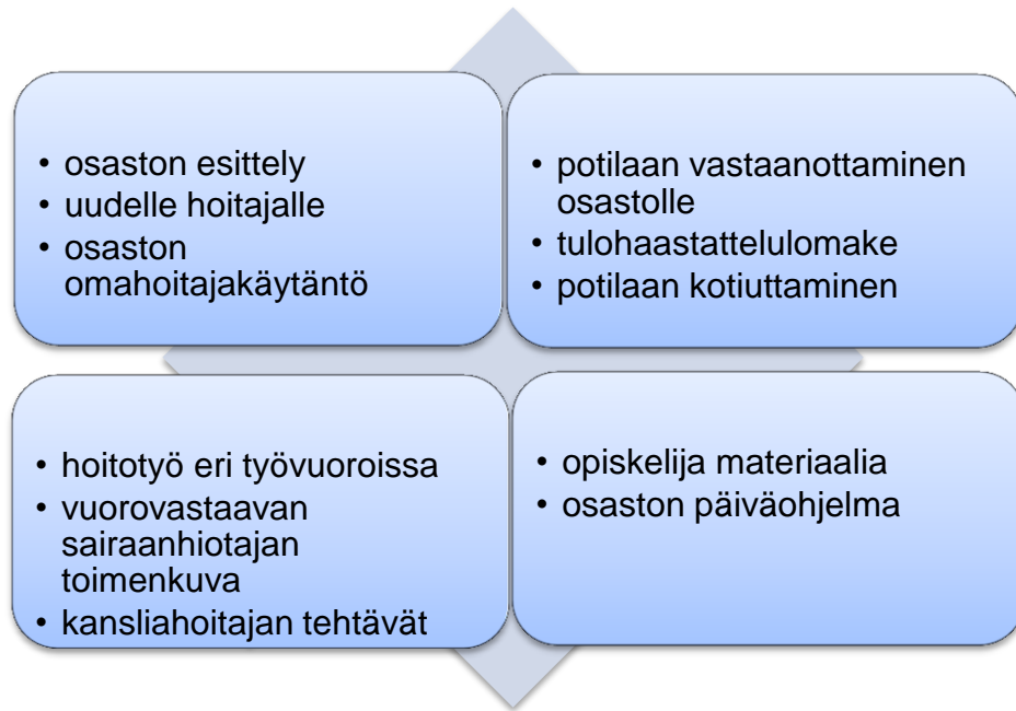
Kuvio 2. Perehdytyskansion ulkonäkö Pirkanmaan sairaanhoitopiirin sisäisillä verkkosivuilla