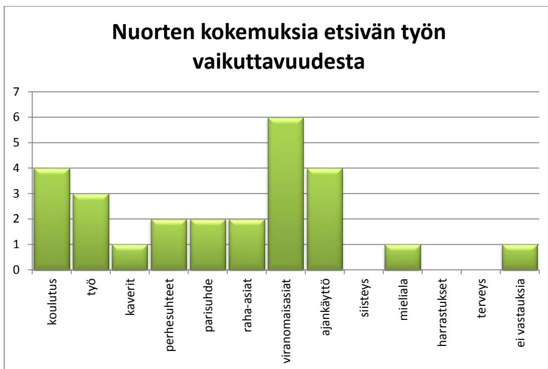
KUVIO 3. Vaikuttavuus. Etsivän työn vaikuttavuus nuorten näkökulmasta. (f).

Toisessa tutkimuskysymyksessä halusimme selvittää onko nuori saanut tietoa niistä asioista, joiden vuoksi hän on tullut etsivään työhön. Halusimme siis selvittää Porin etsivän työn vaikuttavuutta asiakkaiden näkökulmasta. Selvitimme millaisiin eri asioihin etsivä työ voi vaikuttaa nuoren elämässä ja sen pohjalta muodostimme eri vastausvaihtoehtot, joista asiakas sai vastata niin moneen kuin halusi.