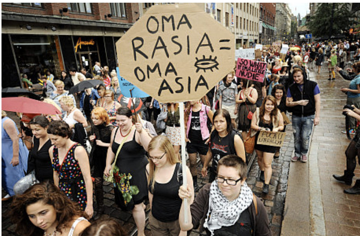
Kuva 3. Esimerkki poliittisesta tapahtumasta jolla on sanoma. Lutkamarssi.

Edellä mainittujen tapahtumien ja toimijoiden lisäksi on myös tapahtumia joilla ei välttämättä ole itseisarvona saada aikaan yhteisöllisyyttä, saada aikaan uusia kohtaamisia tai parantaa asuinympäristöjä. On olemassa myös pelkästään hauskanpitoon perustuvia tapahtumia kuten kaljakellunta tai tapahtumia joilla on poliittisia näkökulmia kuten Lutkamarssi, Kriittinen pyöräretki, Parkkipäivä tai Pride-kulkue.