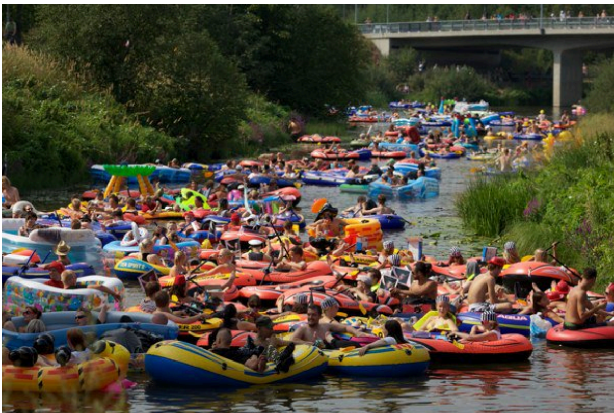
Kuva 4. Kaljakelluntaa Vantaalla ja Helsingissä. Tapahtumalla ei ole varsinaista järjestäjää, vaan ihmiset vaan kokoontuvat yhteen juomaan alkoholia ja nauttimaan päivästä. Tapahtuma on koettu ongelmalliseksi nimenomaan järjestäjän puuttumisen takia. Kuka ottaa vastuun?

Kaupungissa tapahtuu ja tapahtumien lista voisi olla lähes loputon. Uudenlaiset tapahtumat voivat olla valtavan suosittuja kuten Ravintolapäivä tai hyvin pieniä, mutta merkityksellisiä omalle kävijäkunnalleen kuten esimerkiksi avantofestivaali tai urbaani uintifestivaali Edellä käytiin tämän päivän tapahtumatarjontaa läpi muutamien esimerkkitapahtumien kautta, mutta liitteenä olevassa listassa uuden aikakauden tapahtumia on listattu enemmän lisätutustumista varten.