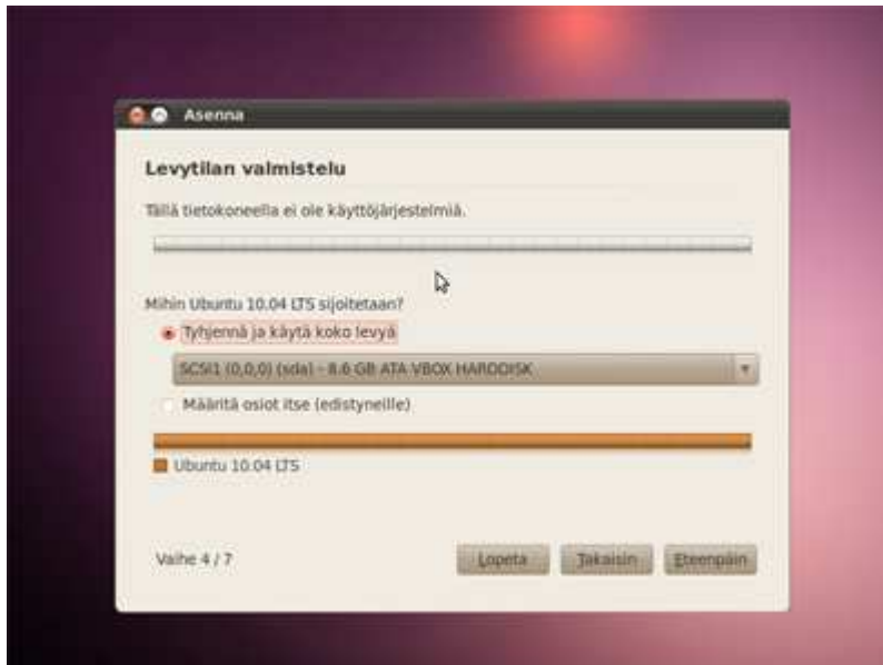
Kuvio 2. Levytilan koon valitseminen.

Kolmannessa vaiheessa valitaan näppäimistön kieli. Listalta voi itse valita halutun kielen näppäimistölle tai voi käyttää arvaa-toimintoa. Näppäimistöä pystyy testaamaan asennuksen yhteydessä olevassa tekstikentässä.