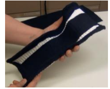
Kuvio 12. Lastan päällystäminen

Videolla kiinnitetään liimapintaiset fleecce - pehmusteet (kuvio 12) lastan reunoille ja keskiosaan. Videossa näytetään kiinnitysnauhojen paikkojen arviointi, asentaminen ja päällystäminen. Kiinnitysnauhojen asentamisen kohdalla mainitaan ja näytetään kuvaleikkeinä kuumailmapuhaltimen käyttö liiman pehmittämisessä. Kuumailmapuhaltimen käyttöä ei voitu videoida kuvauspaikan rakennusteknisten esteiden vuoksi.