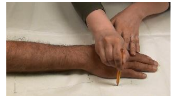
Kuvio 10. Kaavan piirtäminen

Videolla potilaan kädestä mitataan kyynärvarren levein kohta (lastan päättymiskoh- ta), ranteen kohdat, MCP (sormien tyvi-) nivel ja PIP (sormien ykkös-) nivel. Videolla potilaan käsi asetetaan kaavapaperin päälle oikeaan asentoon. Kaavaan merkitään mitatut kohdat oikeille kohdille merkkiviivoineen. Kaa- vaan merkitään peukalon hanka, peukalon kämmennivel ja keskisormen pää. Kaava piirretään (kuvio 10) ja leika- taan irti. Videossa mainitaan kaavan sovitus. Kaava piirre- tään lastamateriaaliin. Lastamateriaalia lämmitetään hetki ja se leikataan oikean muotoiseksi.