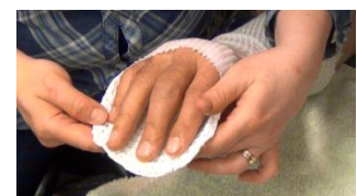
Kuvio 11. Lastan muotoilu

Videossa näytetään pieni osio tietoruutuineen lastan lämmityksestä muotoilukuntoiseksi, jonka jälkeen lasta- materiaali muotoillaan (kuvio 11) potilaan käden mukai- seksi. Videossa muotoilussa on pyritty suurimmaksi osaksi noudattamaan lastan muotoilun teoriaosuutta. Teo- riaosuudesta poiketen lastan tuki ulottuu hieman pidemmälle peukalon tyveen, kos- ka potilaalla on kipua myös peukalon tyvessä. Lisätuen tarkoituksena on tukea kipey- tynyttä kohtaa.