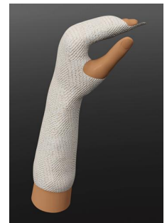
Kuvio 1. Asentohoitolastaa

Asentohoitolastaa (kuvio 1) käytetään käden tukemiseksi korjausleikkauksen jälkeen, jolloin rakenteiden vaurioituminen ja kudosten korjaantuminen vaatii käden liikkumattomaksi asettamisen (immobilisaation). Lastan avulla kudokset saadaan venymättä paranemaan rauhassa. Asentohoitolastoja tarvitaan paranevan jänteen tai nivelsiteen tueksi estämään käden jännekalvon kurouma (kontraktuura). Asentohoitolastoja tarvitaan myös tehtyjen korjausten suojaamisessa ja kudosten venyttämisessä sopivaan mittaan. Asentohoitolastoilla käsi lastoitetaan kudosten paranemista ja käden kuntoutusta tukevaan asentoon, joka onkin asentohoitolastan perusasento (kuntoutusasento, anditeformiteettiasento). Asento-