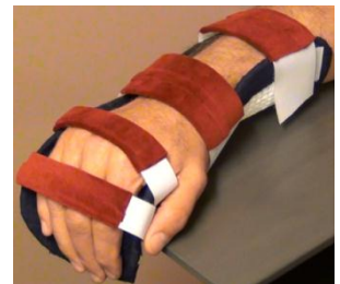
Kuvio 2. Staattinen- eli lepolaista ilman peukalon tukea

että se mahdollistaa tuetun nivelen liikkeen ja ohjaa sitä haluttuun suuntaan (Mikkelsson ym. 2001, 568 - 569). Dynaamista lastaa käytetään useimmiten harjoitettaessa sor-