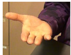
Kuvio 9. Lastatarpeen arviointi

Videossa kuvataan, kuinka arvioinnin (Kuvio 9) sekä mittauksen ja toimintakyvyn arvioinnin perusteella valitaan tarpeiden mukainen lepolasta. Arviointikeinoja sivutaan tässä osiossa pikaisesti, koska koko videon suurin painotus on lastan valmistuksen osa-alueella.