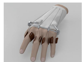
Kuvio 3. Dynaaminen lasta