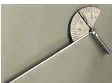
Kuvio 5. Kulmamittari

Yleensä yhtä vaihtoehtoa käyttäessä valitaan oteleveyksistä taso 2 - 3 riippuen potilaan kämmenen koosta. Potilasta pyydetään istumaan ryhdikkäästi selkä- ja käsinojattomassa tuolissa. Häntä neuvotaan pitämään yläraajaa kehon vierellä rentona, kuitenkin irti kehosta. Potilasta pyydetään koukistamaan kyynärnivel 90 asteen kulmaan ja ottamaan puristusvoimamittari käteensä. Häntä ohjeistetaan pitämään asento hyvänä ja puristamaan mittarin kahvaa niin voimakkaasti ja nopeasti kuin pystyy. Puristus toistetaan 2 - 3 kertaan noin 30 sekunnin välein riippuen siitä, kuinka kaukana mittaustulokset ovat toisistaan. Mittaus suoritetaan molemmilla käsillä. (Aaltonen 2004, 180 - 182.)