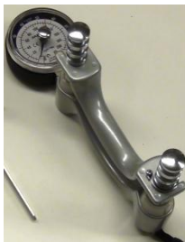
Kuvio 4. Puristusvoimamittari

mittaa käden puristusvoimaa sekä kykyä tarttua esineisiin. Sen avulla selvitetään puristusvoiman heikentymistä ja käsien puristusvoiman symmetrisyyttä. Kulmamittaria käytetään nivelten liikelaajuuksien mittaamiseen ja sillä selvitetään nivelten liikkumisen rajoitteita sekä liikkeiden symmetrisyyttä. Rajoittuneet ja epäsymmetriset liikkeet viittaavat nivelten toimintahäiriöön ja tulehdustilaan. Määritellessä lastahoidon tarpeellisuutta arvioidaan myös yläraajojen toimintakykyä , jolloin arvioinnin apuna käytetään erilaisia liikkeitä ja manuaalista tunnustelua . Mittausten, liikkeiden arvioinnin ja manuaalisen tunnustelun tulokset kertovat toimintaterapeutille, mitkä kehon alueet tarvitsevat mahdollisesti lisätukea (esimerkiksi lastahoitoa) ja kuinka paljon ne sitä tarvitsevat. Esimerkiksi reumatulehdus rajoittaa yläraajan nivelten liikkeitä, heikentää voimaa. Liikkeet voivat olla epäsymmetrisiä sekä aiheuttaa kipua ja ihon kuumotusta, jolloin lastahoito auttaa vähentämään tulehduksen aiheuttamia oireita. (Kaipainen-Seppänen 2007, 41; Viitasalo 2000, 84, 87; Oravainen 2007, 179.)