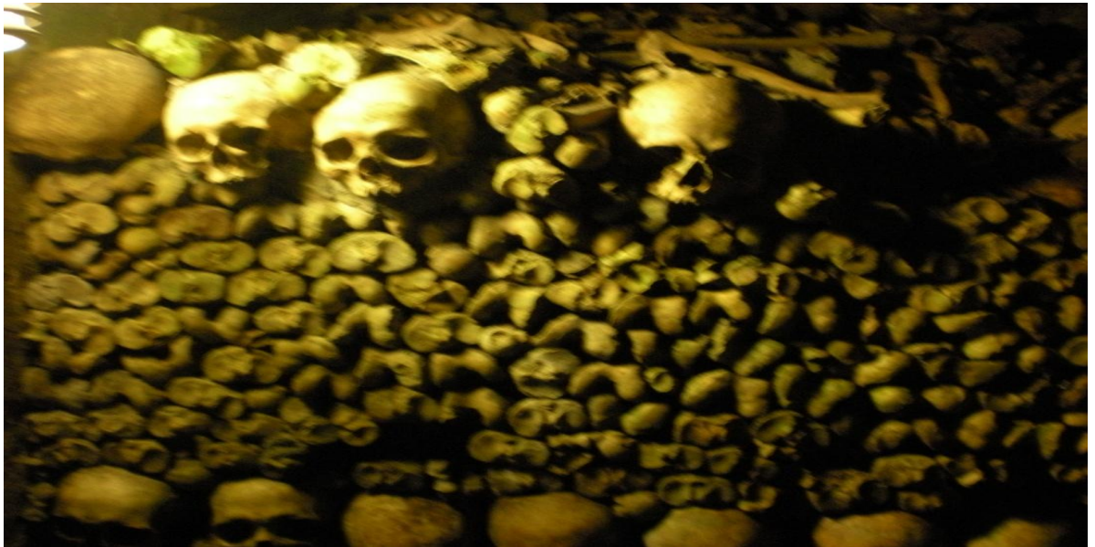
Kuvio 5. Les Catacombs. (Järvelä S-M. 2008.)

Päivällä on vapaata tutustumista kaupunkiin. Päivän aikana voi tutustua ostosmahdollisuuksiin tai vaikkapa kierrellä pienempiä museoita kuten Musée Picasso tai Musée de l'Armée. Yksi Pariisin pelottavimmista ja mielenkiintoisimmista paikoista on Les Catacombs (Kuvio 5.), joka sijaitsee Pariisin alla ja siellä sijaitsee 6 miljoonan pariisilaisen jäänteet.