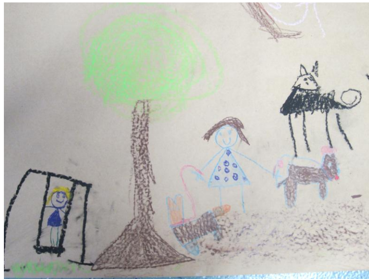
Kuva 4. Itselle tärkeitä asioita

den värillä. Tämän jälkeen he piirsivät sydämen ympärille asioita, joista välittävät ja rakastavat (kuva 4).