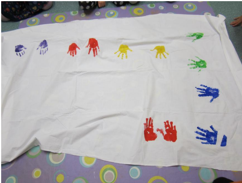
Kuva 2. Rohkeuslakana

Kun kädet oli pesty, siirrettiin lasten tekemät saviset Pelkokeikot lattialle lakanan alle (kuva 2) lapsen kädenjälkien kohdalle ja lapset saivat murskata ja säikäyttää oman pelkokeikkonsa pois hyppimällä sen päällä tai liiskaamalla sen käsillään.