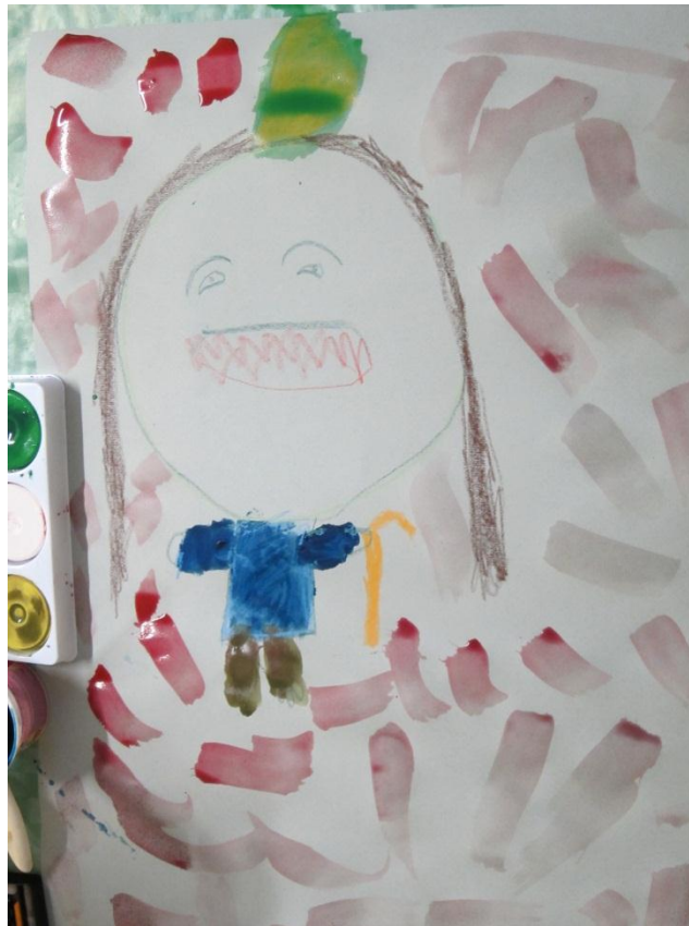
Kuva 3. Känkkäränkkä

Eräältä lapselta ei meinannut tulla vastausta, mutta kysyttäessä esimerkkejä omista perheenjäsenistä tai kavereista hän pystyi kertomaan, että pikkuveli itkee kun sitä kiukuttaa. Keskustelun jälkeen lapset alkoivat piirtää omaa Känkkäränkkäänsä vahaliiduilla. Jokaisella oli oma noin A2-kokoinen kartonki. Neuvoimme ensin tekemään vahaliiduilla ääri viivat ja sitten maalaamaan vesiväreillä. Kannustimme lapsia valitsemaan työhön kiukun värejä ja tekemään omanlaisen Känkkäränkän (kuva 3).