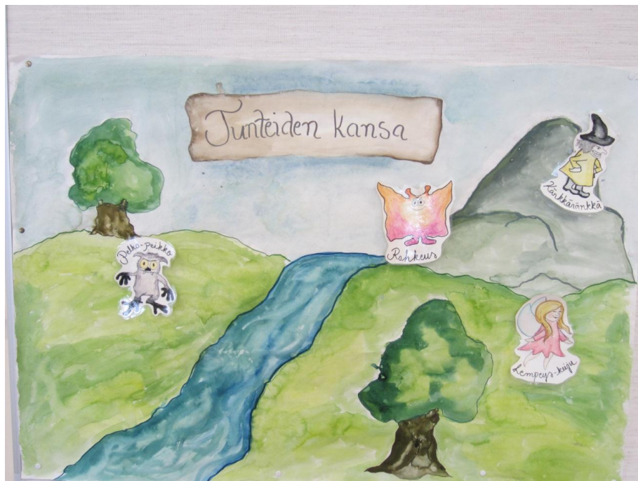
Kuva 1. Tunteiden kansa

Jokaisella ohjauskerralla aiheena olevaan tunteeseen virittäydyttiin ensin tarinan tai musiikin avulla ja sen jälkeen lapset työskentelivät kuvallisesti. Jokaisen kerran päätteeksi esittelimme lapsille tekemämme kyseistä tunnetilaa esittävän hahmon (piirretty paperille ja päällystetty kontaktimuovilla), joka vietiin osaksi Tunteiden kansa -maalausta (kuva 1) kiinnittämällä hahmo sinitarralla maalaukseen. Tunteiden kansan tarkoitus on muistuttaa lapsia käsittelemistämme tunteista ja ohjauskerroista, sekä herättää keskustelua ja pohdintaa tunteista päiväkodin arjessa niin lasten kuin aikuistenkin välillä. Rohkaisimme lapsia myös tekemään Tunteiden kansaan uusia tunne-hahmoja.