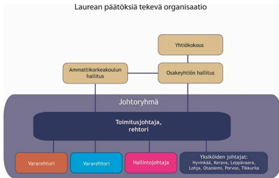
Kuva 2: Laurean organisaatio (Laurea-ammattikorkeakoulu 2011d)

Laurea-ammattikorkeakoulu on yksityinen ammattikorkeakoulu. Laurea toimii osakeyhtiömuotoisena ja sen toimielimiä ovat yhtiökokous, tilintarkastajat, osakeyhtiön hallitus, sekä toimitusjohtaja, joka toimii myös ammattikorkeakoulun rehtorina. Yhtiö ylläpitää ammattikorkeakoulua, opetettavaan alaan liittyvää palvelutoimintaa, sekä omistaa tai vuokraa korkeakoulu kiinteistöjä ja rakennuksia. Osakeyhtiön hallitus hoitaa osakeyhtiölain mukaiset tehtävät ja vastaa siitä, että yhtiötä organisoidaan ja johdetaan asiaan kuuluvalla tavalla. Ammattikorkeakoulun hallitus taas huolehtii ammattikorkeakoululaissa säädettyjen asioiden noudattamisesta ja päättää opetuksen kehittämisen linjoista, opiskelijavalinta- ja koulutusohjelmien perusteista, sekä tekee yhtiön hallitukselle esityksen talousarviosta ja strategian toteuttamissuunnitelmasta. (Laurea-ammattikorkeakoulun toimintasäntö 2011.) Laurean päätöksiä tekevä organisaatio on esitetty tarkemmin kuviossa 3.