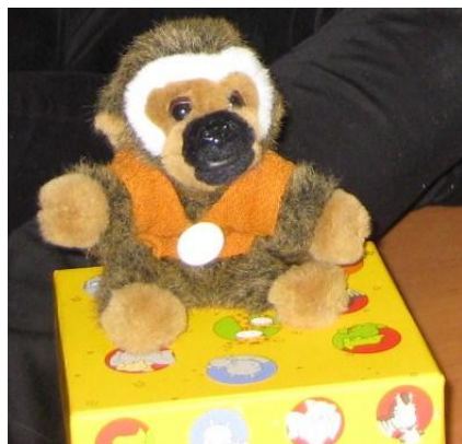
Kuva 2. mediapehmolelu

Keräsimme jokaisen toimintatuokion lopuksi palautetta lapsilta toimintatuokioiden aikana heränneistä tunteista, ajatuksista ja mielipiteistä tunnekuvien ja väittämien avulla. Jokaiselle tuokiolle olimme etukäteen laatineet viisi erilaista väittämää, joista halusimme saada palautetta lapsilta. Lapsilta saatu palaute auttoi kehittämään, suunnittelemaan ja arvioimaan toimintaa.