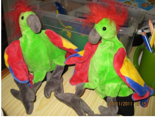
Kuva 1. Papukaijat

Aloitusleikin jälkeen matkattiin Median viidakoon sulkemalla silmät viidakkomusiikin soidessa taustalla. Viidakossa oltiin perillä, kun Papukaija käsinuket saapuivat paikalle (Kuva 1). Tämä auttoi lapsia ennakoimaan, keskittymään ja lisäsi tunnelmaa. Käsinuket antoivat lapsille mediaan liittyviä tehtäviä tai pulmia ratkaistavaksi, sillä media oli viidakosta saapuneille Papukaijoille uusi asia. Lapset pääsivät auttamaan papukaijoja pulmien ja ongelmien selvittämisessä. Näin lapsille elämyksellisellä tavalla virittäydettiin toimintatuokion aiheeseen sekä käsiteltiin sitä yhdessä käsinukkien ja lasten kanssa.