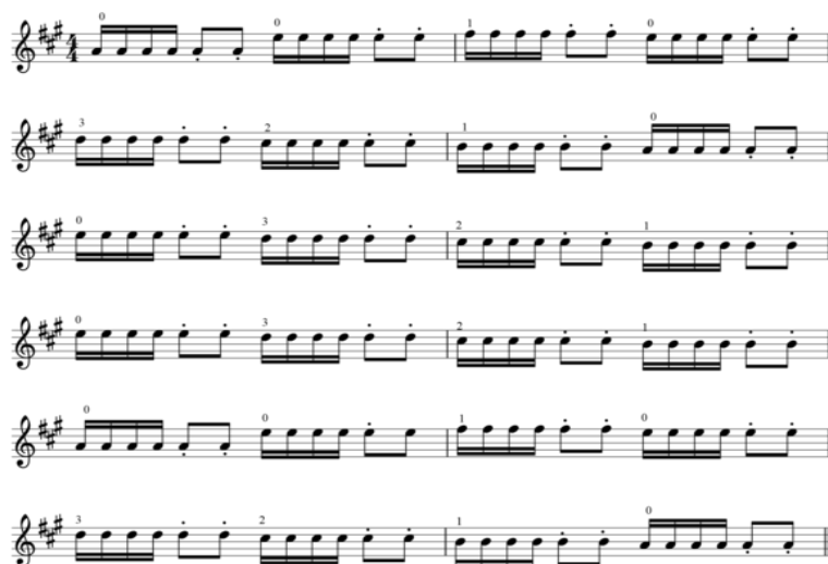
Figur 2. Variation a, Suzukibok 1.