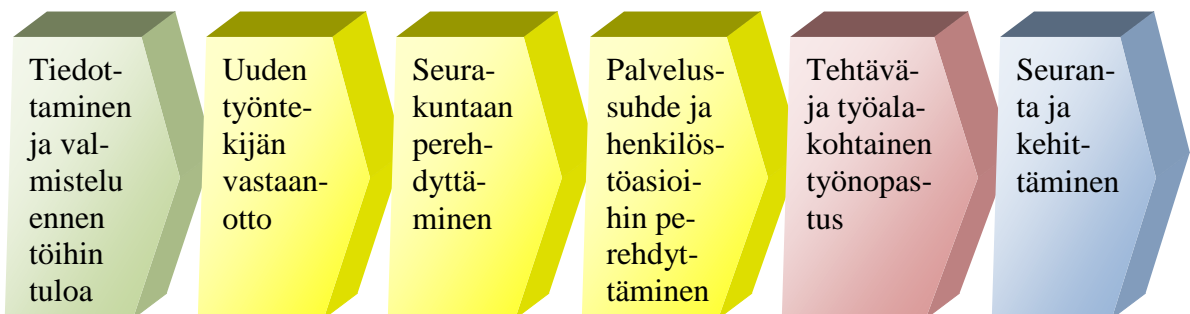
Kuva 3. Perehdytysprosessin askeleet Rovaniemen seurakunnassa