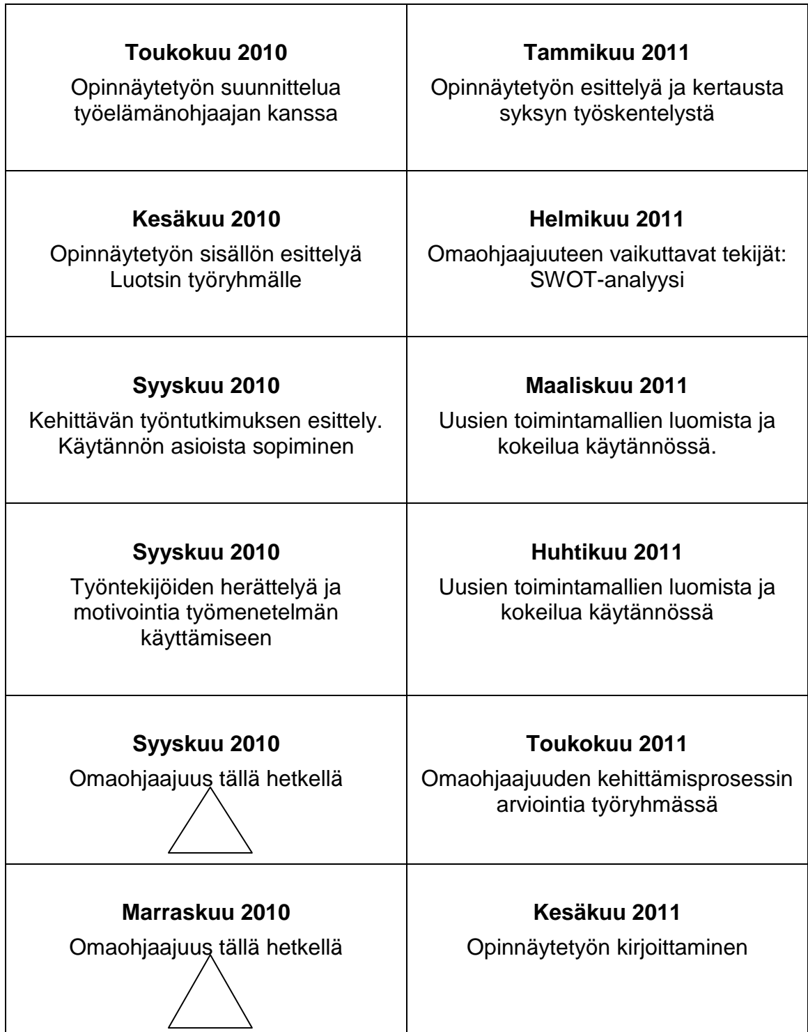
Taulukko 2. Kehittämisprosessin aikataulusuunnitelma

jät suhtautuivat odottavasti; mikä ilmeni työntekijöiden puheissa kesän 2010 aikana. Syksyllä 2010 ensimmäisessä palaverissamme herättelimme ja motivoimme työyhteisöä tulevaan työskentelyyn. Kerroimme tulevan prosessin aikataulusta, vaiheista ja käytännöistä.