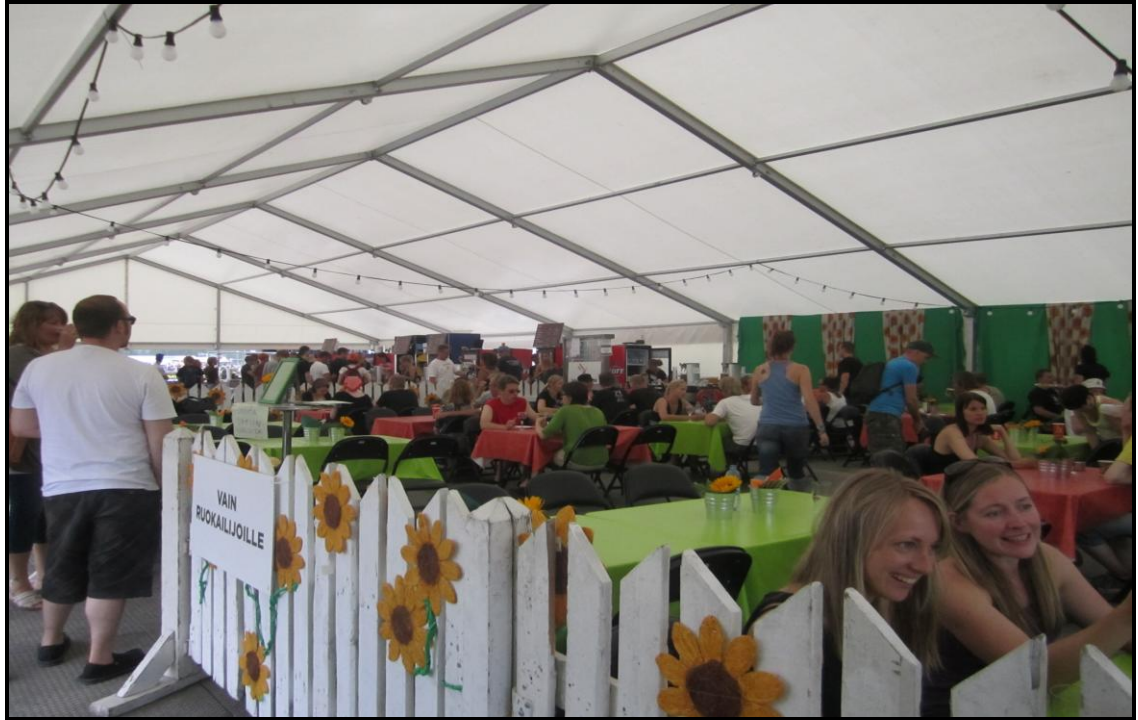
Kuva 2. Ruisbistro-ravintola kuvattuna anniskelualueelta.

Ruisbistron johdattamiseksi ravintolan läheisyyteen on kasattu isoja mainoksia, sillä muutoin ravintolan löytäminen, vaikka se keskeisellä paikalla onkin, anniskelualueelta voisi olla hieman vaikeaa. Myös paperisessa festivaaliohjelmassa on pieni bistron ruokalista.