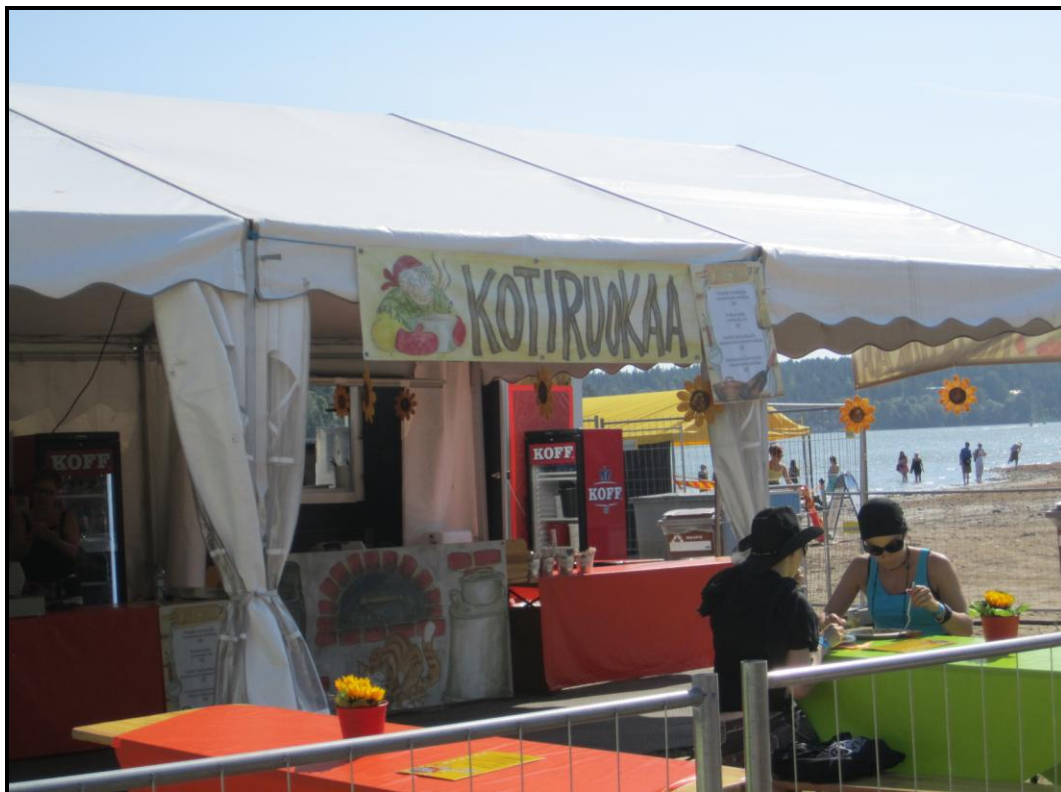
Kuva 5. Rantabistro-ravintolan julkisivu.