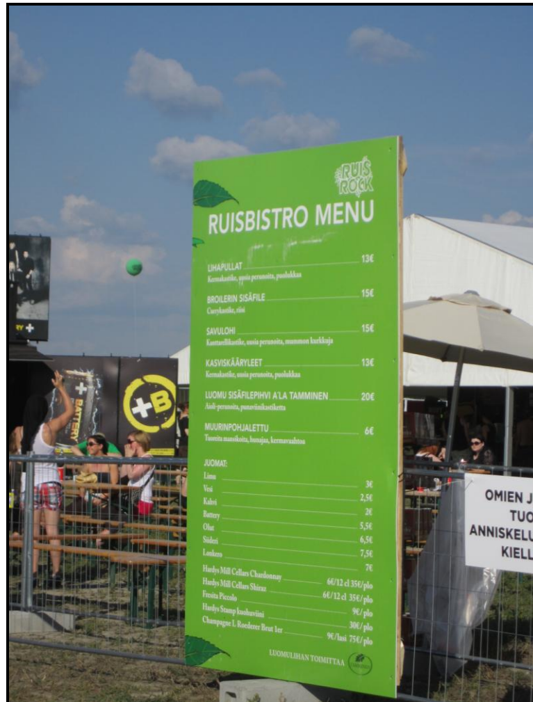
Kuva 3. Ruisbistron ruokalista 2011.