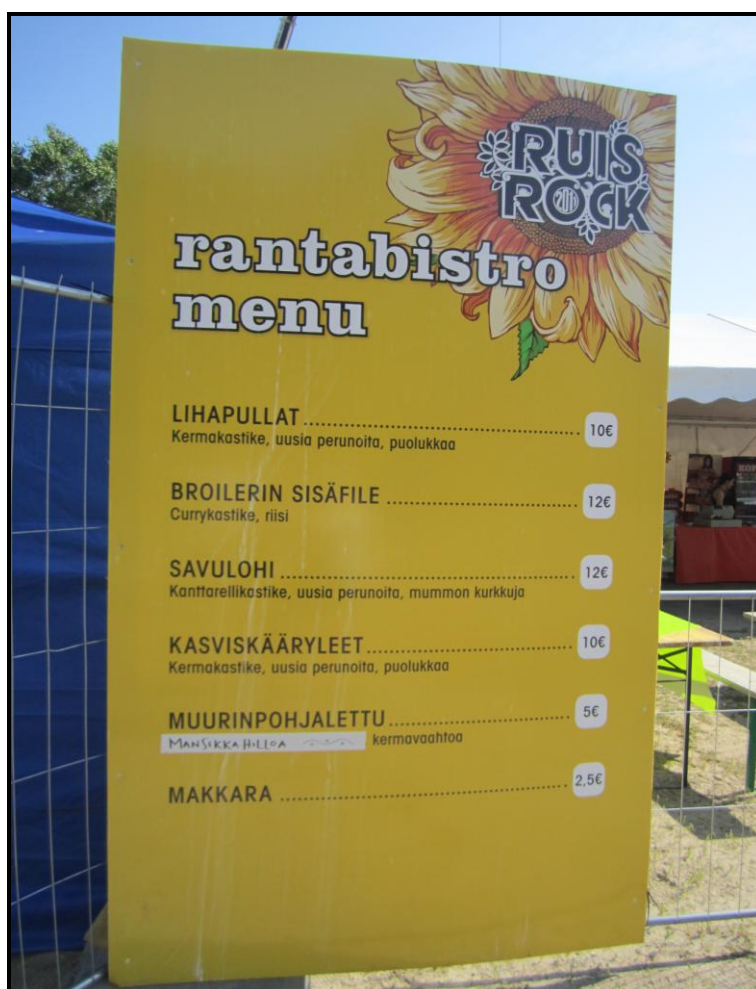
Kuva 4. Rantabistron ruokalista 2011.

Rantabistro on erittäin näkyvällä paikalla. Ensimmäinen asia, mikä kiinnittää ohikulkijan katseen, on värikäs kyltti, jossa lukee ”kotiruokaa”. Tämä herättää varmasti jo sellaisenaan usean festivaalivieraan kiinnostuksen. Rantabistro on muutoin sisustukseltaan hieman vaatimattomampi kuin Ruisbistro. Ravintolan sijainti on kuitenkin erittäin potentiaalinen, sillä se sijaitsee festivaalivieraiden päivittäisen kulkureitin varrella.