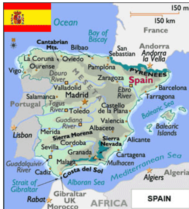
Kartta 1. Espanjan kartta (ISPOR 2010).

Espanjan kuningaskunta sijaitsee Iberian niemimaalla, Lounais-Euroopassa, Välimeren ja Atlantin välissä (kartta 1). Maan raja- ja naapurivaltioita ovat Portugali ja Ranska. Espanja on pinta-alaltaan 505 370 km 2 , sisältäen myös Kanariansaaret ja Baleaarit sekä Afrikan puolella sijaitsevat Ceutan ja Melillan. Maa onkin Euroopan neljänneksi suurin Venäjän, Ukrainan ja Ranskan jälkeen. Espanja on jaettu 17 eri itsehallintoalueeseen, jotka puolestaan on jaettu maakuntiin. Itsehallintoalueet ovat Andalusia, Aragonia, Asturia, Baleaarit, Baskimaa, Extremadura, Galicia, Kanariansaaret, Kantabria, Kastilia -La Mancha, Kastilia y León, Katalonia, Madrid, Murcia, Navarra, La Rioja ja Valencia. Suurimmat kaupungit ovat pääkaupunki Madrid, Barcelona, Sevilla ja Valencia. Vuoden 2010 alussa väestön lukumäärä oli yli 46 miljoonaa. (Aguelo Navarro 2008, 18–20; Central Intelligence Agency 2011.)