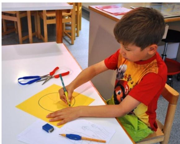
Oikeanlaisia käden otteita tukevia pienapuvälineitä, kynänpaksunnokset sekä joustosankaiset sakset

Arkea helpottamaan on saatavilla erilaisia pienapuvälineitä, joiden tarpeen toimintaterapeutti arvioi yksilöllisesti. Pienapuvälineillä pyritään tukemaan niveliä säästäviä toimintatapoja sekä mahdollistamaan arjen toimintojen sujuvuutta, esimerkiksi leikeissä, peseytymisessä, pukeutumisessa, ruokailussa ja koulunkäynnissä. Pukeutumisessa on huomioitava lapsen omatoimisuuden tukeminen lähtien vaatteiden asettelusta lapselle sopivalle korkeudelle. Olisi hyvä suosia vaatteita, jotka ovat helppoja pukea päälle, eivätkä kiristä. Jos esimerkiksi napittaminen tai solmiminen tuottaa vaikeuksia, voi sen korvata tarrakiinnityksellä.