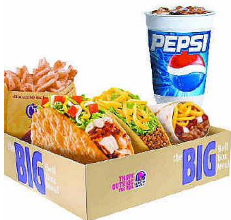
Kuva 10: Taco Bell-pikaruokalan mainoskuva tuotteestaan. (Taco Bell).