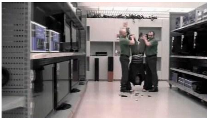
Kuva 5: Verkkokauppa.comin television mainos. (Digitoday).

Alla on kuva televisiossa pyörineestä mainoksesta. Mainos näyttää kuvaa kodinkoneliikkeestä, jossa kaksi myyjän näköistä miestä roikottaa ostajaa jaloista ja yrittää tällä tavoin tyhjentää tämän taskut. Ruutuun ilmestyy teksti "ryöstetäänkö sinut kodinkoneliikkeessä". Expert- ketjun mielestä mainos viittaa suoraan tai epäsuorasti siihen. Tv-mainos näytti tuotevertai- lua, jonka mukaan Panasonicin 42 tuuman televisio maksoi Expertissä 649 euroa ja Verkkokauppa.comissa 499 euroa. Markkinatuomioistuin antoi lausunnon tästä vertailevana markki- nointina, joka on Suomessa kiellettyä. (Taloussanomat 2010.)