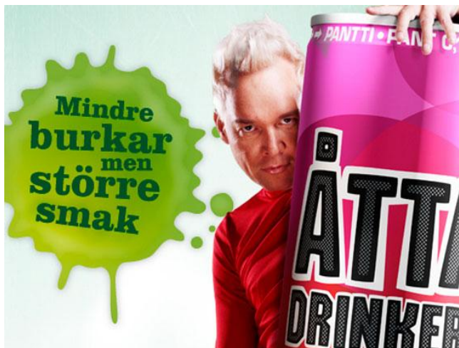
Kuva 3: Hartwallin Åttå Drinkero-lonkeron mainos.