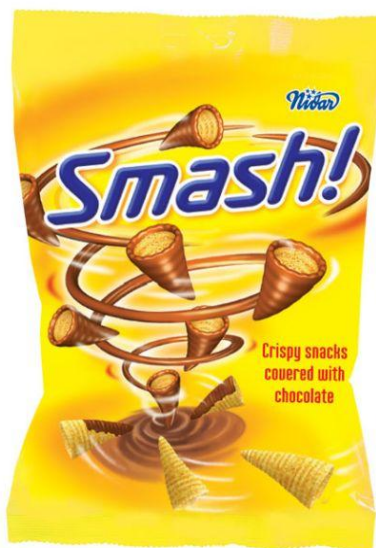
Kuva 4: Pandan Smash-makeispussin ulkoasu. (Panda).

Kuluttajavirasto vaati syksyllä 2008 makeisyhtiö Pandaa luopumaan väkivaltaisesta tv-mainoksesta. Vaatimukset koskevat kuvassa näkyvää Pandan jakelemien norjalaisten Smash!-karkkien mainosta (kuva 4.) Pandan karkkimainos rikkoo markkinoinnin perussääntöjä mainonnan eettisen neuvoston mukaan.