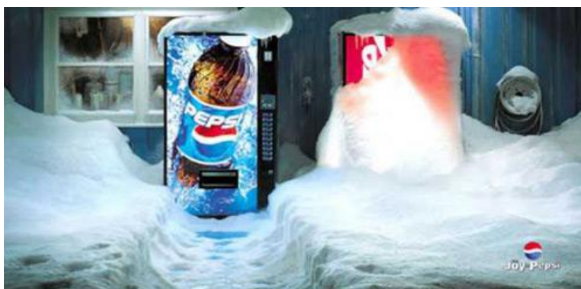
Kuva 6: Pepsi-irvoitusjuoman mainos Yhdysvalloissa.