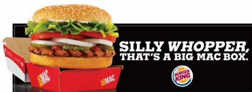
Kuva 8: Burger Kingin mainos, jossa tehdään vertausta McDonald'sin tuotteeseen. (Burger King).