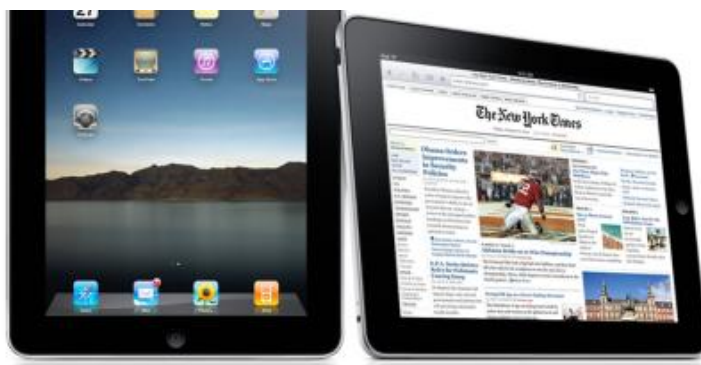
Kuva 7: Applen iPad-tuote. (Apple).

Applen aseman vahvistuminen ja yhtiön toisinaan ronskit otteet eivät ole jääneet huomaamatta viranomaisilta. Lehtien lähteiden mukaan viranomaiset ovat alkaneet tutkia mainoskiistaa, jota Google protestoi kesällä 2010. (Tietokone 2010.) Alla olevissa kuvissa on Applen iPad-tuote.