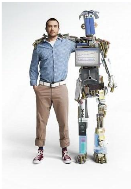
Kuva 1: Sampo Pankin mainoskampanja oman talouden hoitamisesta. (Sampo Pankki).

töstä. Suomen Numeropalvelu sai 100 000 euron sakot määräävän markkina-aseman väärinkäytöstä tilaajatietojen myynnissä puhelinluettelojen valmistamista varten.