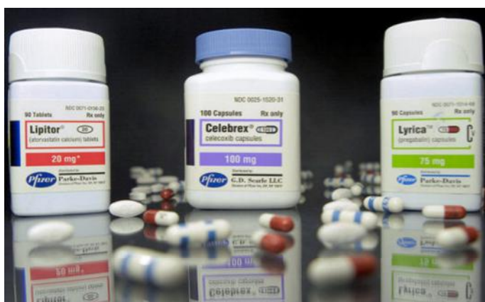
Kuva 8: Esimerkkejä lääkeyhtiö Pfizerin lääkkeitä. (Pfizer).

Seuraavassa kuvassa on eräitä Pfizerin valmistamia lääkkeitä.