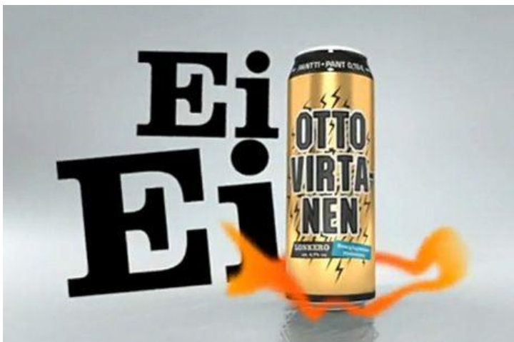
Kuva 2: Hartwallin Otto Virtanen -lonkeron mainoskampanja. (Hartwall).

Ohjeen mukaan yllä olevassa kuvassa esitettyä Otto Virtanen-nimistä long drink -juomaa ei saa mainostaa siinä muodossa kuin sitä silloin mainostettiin. Valvira myös kehottaa Hartwallia poistamaan internetsivustoltaan siellä olevat Otto Virtanen-kampanjan mainosvideot sekä Radiomedian sivustolla olevat Otto Virtanen-radiospottimainokset. Lisäksi Valvira kehottaa yhtiötä olemaan käyttämättä 15.5.2011 jälkeen Otto Virtanen-juoman myyntipakkauksessa sanaa energiajuoma. (Valvira 2010.)