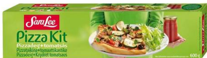
Kuva 11: Sara Leen Suomessa mainostama Pizza Kit-tuote. (Sara Lee).

Alla on kuva Suomessakin tutusta Sara Leen tuotteesta.