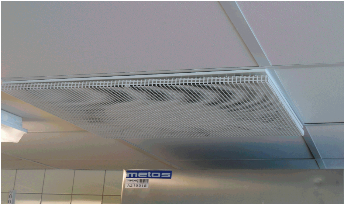
KUVA 3. Keittiössä käytettiin myös Ecophon Focus -akustiikkalevyä

Luokkahuoneissa on käytetty alakattomateriaalina Ecophon Focus -akustiikkalevyä. Peruslevyn lasivillan näkyvällä pinnalla on erillinen pinnoite ja taustapinnalla lasihuopa. Reunat on maalattu. Kuvassa 3 on esitetty tuloilmalaite ja akustinen kattomateriaali.