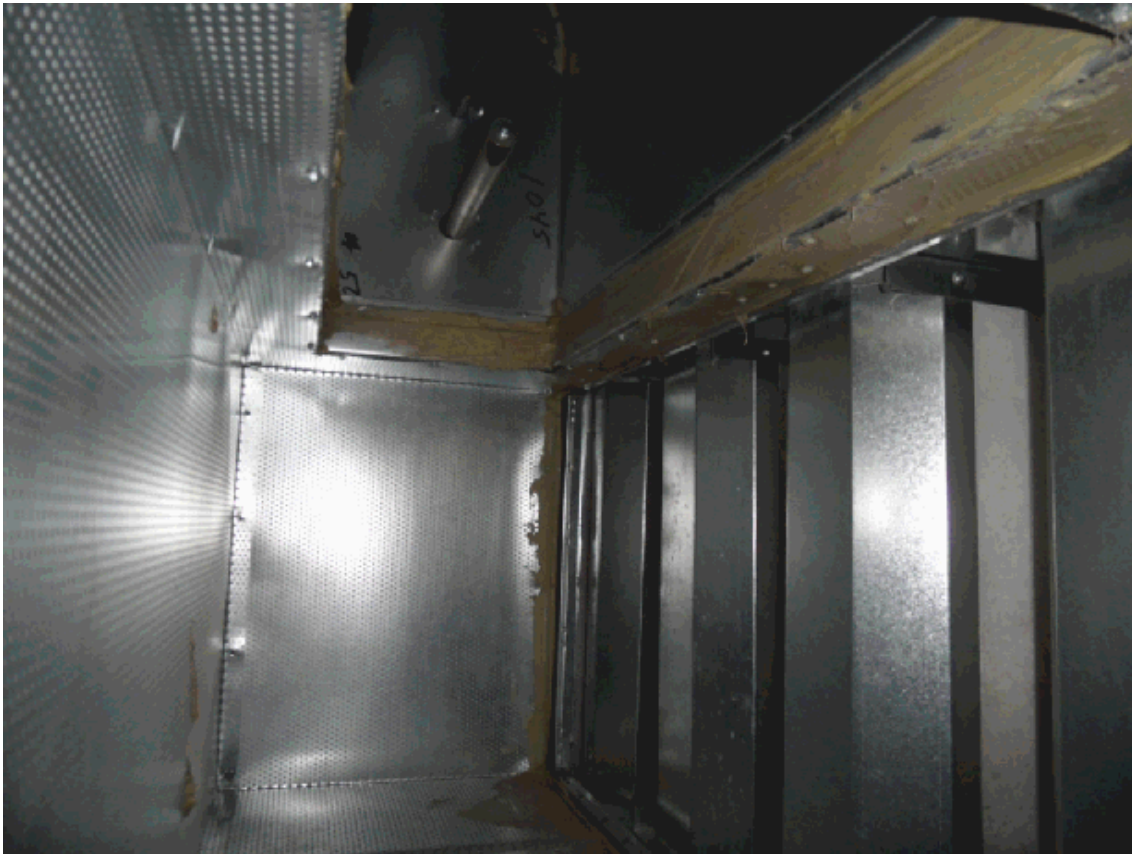
KUVA 2. Äänenvaimennettu ilmanvaihtokammio

erityisesti tuloilmapuhaltimien aiheuttaman melun kulkeutumista sisätiloihin ja ulos rakennuksesta. Äänenvaimennusta tarvitaan myös kanavissa, säätölaitteissa ja päätelaitteissa syntyvän melun sekä tilasta toiseen kulkeutuvan melun vaimentamiseen. Kohteessa on vaimennusmateriaalina käytetty Dacronia, joka on polyesterikuitua. Valmistajan mukaan kuitujen irtoaminen vaimennusmateriaalista on estetty käyttämällä sidosainetta. Irrotettavat vaimennuselementit mahdollistavat vaimennusmateriaalin vaihtamisen. Äänenvaimentimien koot valmistetaan asiakkaan toivomusten mukaisesti. Kuvassa 2 on esitetty ilmanvaihtokammio, jossa on poistettu mineraalivilla ja korvattu polyesterikuitu Dacronilla. (IVK Tuote Oy. 2011, linkit Tuotteet -> Lamellivaimentimet suorakaidekanaviin -> KVA/KVD.)