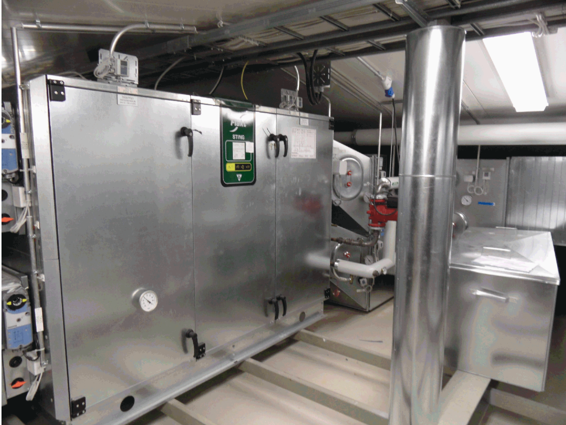
KUVA 1. Sting-ilmastointikone liiketalouden yksikössä

tasoa. Kuvassa 1 on esitetty Sting-ilmastointikone ja taulukossa 4 on esitetty koneiden malli ja koko.