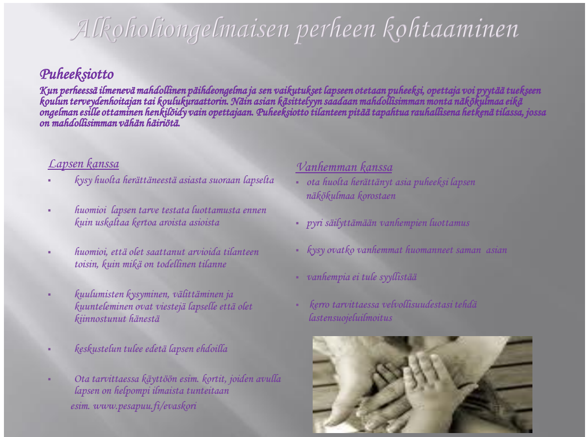
Kuva 1. Esimerkki oppaan sivusta

löytää nopeasti tarvitsemansa tiedon. Alla esimerkkikuva valmiista verkkosivusta.