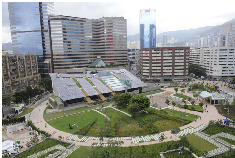
圖 2. 香港的零碳天地

香港首座零碳建築名為「零碳天地」( http://zcb.hkcic.org )，位於九龍灣常悅道，造價2.4億港元，於2012年6月揭幕。「零碳天地」佔地14,700平方米，當中包括室內及戶外的展覽場地、會堂、綠色辦公室、綠色家居、公眾休憩綠化區及香港首個都市原生林。該建築是直接連通至當地