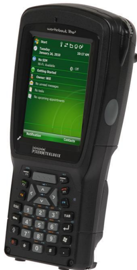
Kuva 3. Workabout Pro 3 – mobiilipäätelaite. [3]

Tiedän, että esimerkiksi Suomessa Schenker Cargo Oy:llä on käytössään Psion Teklogixin Workabout Pro -tuoteperheen mobiilipäätelaitteita.