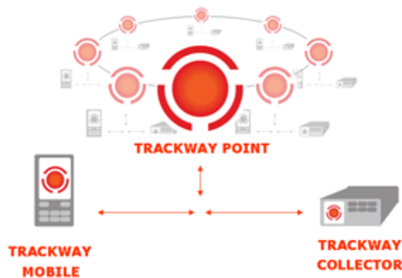
Kuva 2. Trackway- tuoteperheen toimintakuvaus [2]

Kuvassa 2 esitetään toimintaperiaate siitä kuinka Trackway Collector ja Trackway Mobile toimivat paikallisina ja liikkuvina yhdyslinkkeinä Trackway Pointiin .