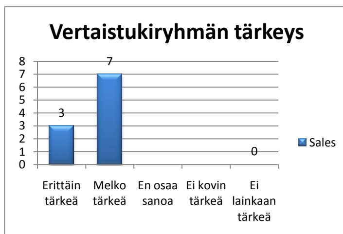
KUVIO 1. Vertaistukiryhmän tärkeys

Vertaistukiryhmästä oli jo aikaisemmin esitetty toiveita, ja meidän tehtävämme oli kartoittaa todellista tarvetta VETURI -vertaistukiryhmän avulla. Vanhempien keskustelujen aikana kävi useaan kertaan ilmi vertaistuen tärkeys. Tämä näkyi myös vanhemmille teettämässämme kyselyissä. Vanhemmat ovat itse aikaisemmin järjestäneet vertaistukiryhmän kokoontumisia, mutta lopulta he kokivat sen liian rasokkaaksi, koska oma vertaistuen saanti jäi usein järjestelyjen jalkoihin. Kevään edetessä ajatus ryhmän tärkeydestä vahvistui entisestään.