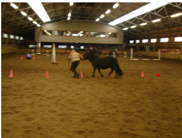
KUVIO 7. Poni-agilityradalla pujottelua (Latvala, J. 2010.)

Poni-agilitykisaan siirryttiin sen jälkeen kun jokainen oli saanut kokeilla hevosen käsittelyä, ajoa ja ratsastusta sekä esittää kysymyksensä ohjaajille. Avustajani veivät käsittelyssä ja talutusratsastuksessa olevat hevoset pois ja hakivat tilalle kaksi ponia lisää. Poneilla oli päässään vain riimut ja riimunnarut taluttamista varten. Kävin ryhmän kanssa yhdessä radan lävitse kävellen ilman poneja.