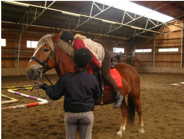
KUVIO 4. Satulasta laskeutuminen (Latvala, J. 2010.)

Ensimmäisellä ratsastuskerralla on tarkoitus saada tuntuma hevosesta selästä käsin; kuinka hevonen pysähtyy ja lähtee liikkeelle. Ensimmäisillä ratsastuskerroilla vauhdin ei tarvitse olla nopea. Tarkoituksena on saada ratsastajalle tuntuma hevosen liikkeistä.