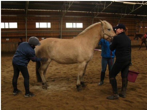
KUVIO 5. Hevosen käsittelyä (Latvala, J. 2010.)

Tiistaina 14.9.2010 pyysin opiskelutovereitani esittämään asiakkaita, joilla ei ole aikaisempaa kokemusta hevosista. Avukseni otin kaksi muuta opiskelijaa, jotka auttoivat asiakkaiden ohjauksessa ja hevosten käsittelyssä. Ennen tilaisuuden alkamista rakensin agilityradan maneesin tiloihin. Yksi poneista valjastettiin kärryajeluun, yksi hevonen satuloitiin talutusratsastusta varten ja toinen hevonen talutettiin maneesiin hevosen käsittelyä ja harjausta varten (Kuvio 5).