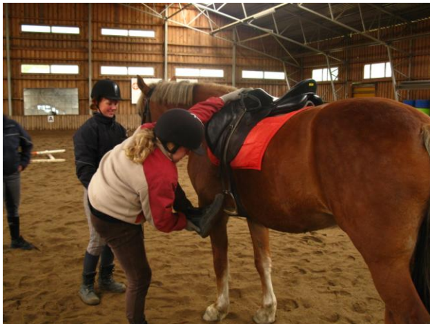
KUVIO 3. Satulaan nouseminen (Latvala, J. 2010.)

Ratsastaminen on ensikertalaisten kanssa toteutettava aidatulla alueella turvallisuussyistä. Heti ensimmäisestä kerrasta lähtien ratsastajan on hyvä opetella oikea tekniikka nousta satulaan. Hevosen selkään noustaan hevosen vasemmalta puolen. Raippa on vasemmassa kädessä, johon ratsastaja myös kokoaa hevosen ohjat. Vasen jalka nostetaan jalustimelle. (Kuvio 3) Vasen käsi tarttuu hevosta harjasta kiinni, satulan edestä. Oikealla kädelle kurkotetaan satulan yli ja tartutaan satulan etukaaresta kiinni. Aseennon ollessa hyvä, ponnistetaan maassa olevalla oikealla jalalla ja noustaan satulaan nostaen oikea jalka hevosen yli. Satulaan nousun oikea tekniikka on turvallinen sekä hevoselle että ratsastajalle. Moni saattaa selkään noustessa tarttua satulan takakaaresta kiinni, mutta se vääntää satulan runkoa ja pidemmällä aikavälillä saattaa rikkoa satulan.