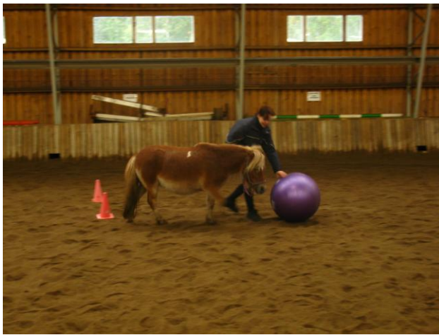
KUVIO 8. Poni-agilityradalla pallon pyörittystä (Latvala, J. 2010.)

Radalla oli matalia esteitä, pujottelua, puomeista rakennettuja sokkeloita, pressun ylitystä, jumppapallon vieritystä toisella kädellä ja ponin paikalla seisottamista muutaman sekunnin ajan (kuvio 7, s.25 ja kuvio 8). Virheitä kertyi, jos ei suorittanut tehtävää annetulla tavalla. Yksi avustajistani otti aikaa. Ajanottamisella radoista tuli vauhdikkaita ja jokainen yritti tosissaan päihittää toisten aikoja. Jokainen oli päässyt käsittelemään, ajamaan ja ratsastamaan hevosia ennen agilitya. Agilityn tarkoituksena on päättää ohjelmapalvelu rentoon oloon, koska monelle hevosen kanssa ensikohtaaminen voi olla pelottava kokemus. Lisäksi tarkoituksena oli saada muut kannustamaan suorittavaa paria radan loppuun saakka.