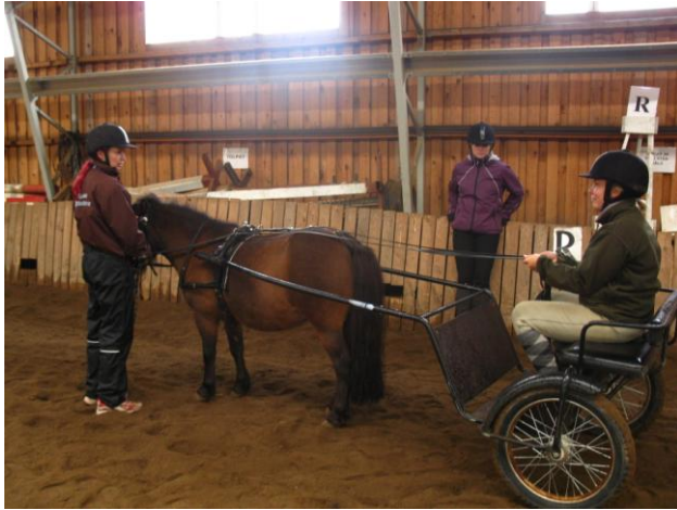
KUVIO 6. Ajoharjoitus (Latvala, J. 2010.)

Pienissä ryhmissä tapahtuva opastus ja ohjaaminen ovat myös turvallisuusasioita. Tällöin varmistetaan, että jokainen saa tarpeeksi ohjausta ja kaikki kuulevat annetut ohjeet. Pyysin jokaista testiin osallistujaa pukemaan ylleen kypärän ja laittamaan käteen hanskat. Kypärä tulee olla aina päässä ajettaessa ja ratsastaessa. Hanskat suojaavat käsien nahkaa, jos hevonen lähtee taluttaessa vetämään ratsastajasta pois päin.