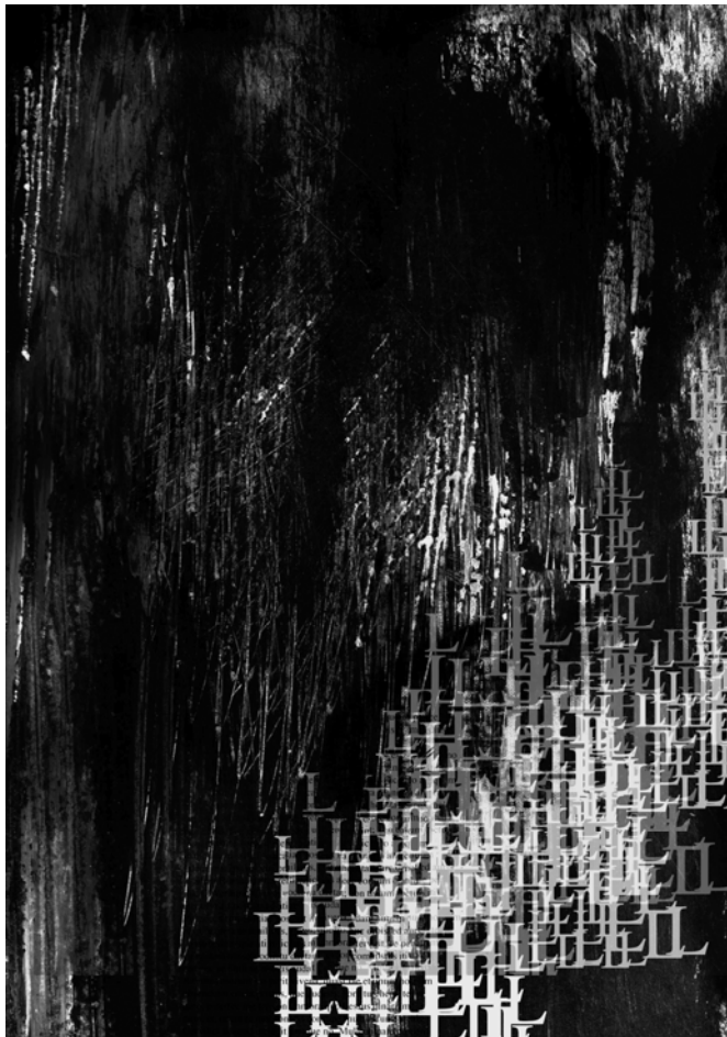
Savolainen, M. 2010. Yksi sivu notaatiosta.