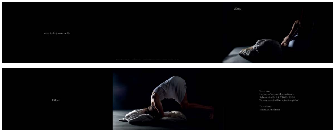
Savolainen, M. 2010. Kutsukortti edestä, takaa ja avattuna.