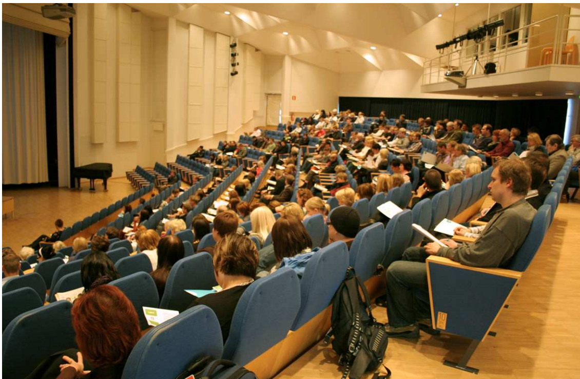
Kuvio 1: Risto Ryti –sali oli täynnä sosiaalisesta mediasta kiinnostuneita kuulijoita

Seminaariin ilmoittautui ennakkoon n. 130 henkilöä, mutta Risto Ryti –sali täyttyi yli odotusten. Osallistujalistaan nimensä kirjasi 180 henkilöä, mutta kaiken kaikkiaan paikalla oli lähes 300 osallistujaa.