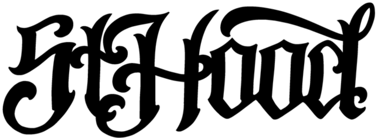
Kuva 2. Bändin logo

Logossa ja levyn nimessä käytetty tyyli on tällä hetkellä melko muodikasta latino-tatuointitaiteesta tuttua. Nimityksiä sille on monia. Kyseisestä tyylistä tunnettu latinalais-amerikkalainen tatuointitaiteilija Boog mainitsee kirjassaan sitä kutsuttavan ainakin vankila-, ghetto- tai chicano-tyyliksi, urbaaniksi taiteeksi tai katutaiteeksi. Hänen mukaansa sen kutsumanimen käyttö riippuu puhujan suhteesta taiteenlajiin, tai arvostuksesta sitä kohtaan. (Boog 2007, 129)