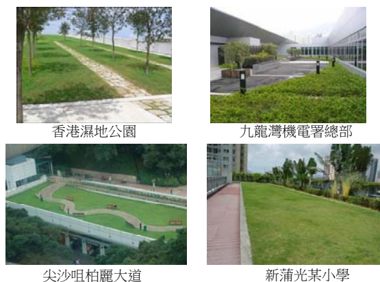
圖 2 香港屋頂綠化的例子

在香港，屋頂綠化近年來備受關注，其實是大有原因的。據研究指出，屋頂綠化可以幫助減輕城市熱島，並把大自然帶回市區。他們不僅可以幫助降低城市溫度和減少建築能源消耗，還能提高城市美觀，以及減少污染物濃度和噪音。圖 2 展示一些香港屋頂綠化的例子。其實，一些住宅建築的景觀型式的平台花園，也可以稱得上是綠化屋頂或屋頂花園，這些平台花園在香港較為普遍。