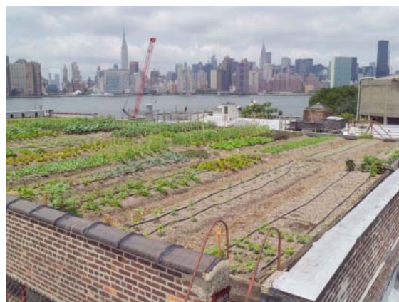
(來源: http://blog.anandaharvest.org )

在當今世界，越來越多的屋頂可以被利用，發揮綠化和農業的作用，以改善城市環境，提高城市生活的質量。屋頂城市農業是一種新的觀念來達到可持續宜居城市。雖然在城市種植糧食會有一些限制，但它可以提供許多環境、社會和經濟效益。研究發現，香港有很好的潛力，可以促進屋頂城市農業。據了解，在世界上的許多城市，屋頂綠化的農業運動，才剛剛開始，最重要的是要認真考慮技術問題和當地的條件。大家需要進一步努力，以開發設計準則和增強實踐經驗。