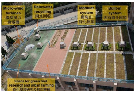
圖 3 在香港一所小學進行的屋頂綠化和城市農業的試驗性研究( http://www.hku.hk/bse/greenroof/ )

圖 3 顯示了一個小學禮堂的屋頂，採用了以下的可持續技術：(1) 收集雨水用來灌溉植物；(2) 從微型風力渦輪機發電力來推動水泵；(3) 通過堆肥來提供種植的肥料。希望通過研究屋頂綠化以及這些可持續技術，可以幫助推展城市綠化和環保綠建築。有關這些研究的詳細情況和其他屋頂綠化的參考資料可以到以下網站瀏覽： http://www.hku.hk/bse/greenroof/