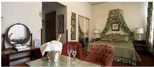
Kuva 3. Kartanohotellin 2 hengen huone (Haikko 2008c.)

Kartanohotellin huoneet ovat yksilöllisiä ja sisustettu 1860-luvun tyylin mukaisesti (Kuva 3). Rakennuksessa on erillinen vastaanotto ja useita erilaisia ravintolasaleja. Tiloissa on myös Kartanon klubi ja kesäisin terassi. Lisäksi kartanon tiloihin kuuluu Kristallikabinetti 12 hengelle. (Haikko 2008d.)