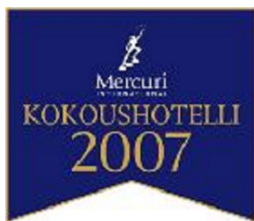
Kuva 1. Haikko vuoden paras kokoushotelli 2007 (Haikko 2008b.)