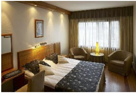
Kuva 2. Kylpylähotellin 2 hengen huone (Haikko 2008c.)

Kartanohotellin huoneet ovat yksilöllisiä ja sisustettu 1860-luvun tyylin mukaisesti (Kuva 3). Rakennuksessa on erillinen vastaanotto ja useita erilaisia ravintolasaleja. Tiloissa on myös Kartanon klubi ja kesäisin terassi. Lisäksi kartanon tiloihin kuuluu Kristallikabinetti 12 hengelle. (Haikko 2008d.)