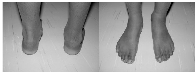
Figura 1 - Paciente de 9 anos com PTC à direita com 8 anos de pós operatório e Índice de Lehman de 85.

O exame de ultrassonografia com Doppler colorido foi feito no mesmo dia da avaliação clínica. Durante o exame, foi feita a tentativa de identificação das artérias tibial anterior e posterior na altura da articulação do tornozelo, sempre bilateralmente. Em 12 destes pacientes foram obtidos os valores de fluxo e calibre das artérias tibial anterior e posterior para posterior comparação.