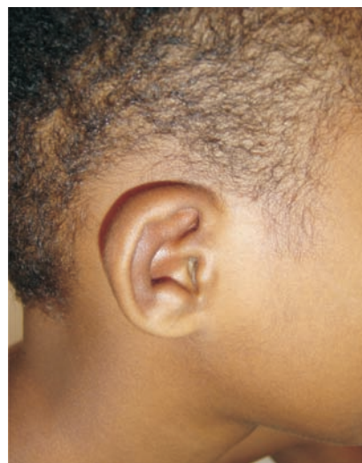
Figura 2 - Condrite em orelha direita.

Ao exame de admissão, além da artrite, foram observados queda do estado geral, febre alta (39° C), achatamento do nariz (Figura 3), dor à palpação de articulação sacroilíaca direita e entesite em calcâneos. Negava quadro infeccioso progressivo e atividade sexual antes do aparecimento das manifestações articulares. Foram realizados outros exames: anticorpo antinúcleo, fator reumatóide, HLA-B27 e anticorpo contra citoplasma de neutrófilos negativos. Realizados ecocardiograma, radiografia de tórax e urina tipo I que foram normais. PPD não reagente. Feita hipótese diagnóstica de PR (poliartrite não-erosiva soronegativa com condrites nasal e auricular e inflamação ocular), foram iniciados naproxeno (15 mg/kg/dia), pulsoterapia com metilprednisolona (1 g por via endovenosa, por três dias), seguidos de prednisona 60 mg/dia e ciclosporina na dose de 3 mg/kg/dia com aumento progressivo para 5 mg/kg/dia. Foi observada significativa melhora do estado geral, da poliartrite e dos processos inflamatórios auricular e nasal. Depois de 40 dias de internação, o paciente recebeu alta e foi encaminhado para o ambulatório de reumatologia pediátrica.