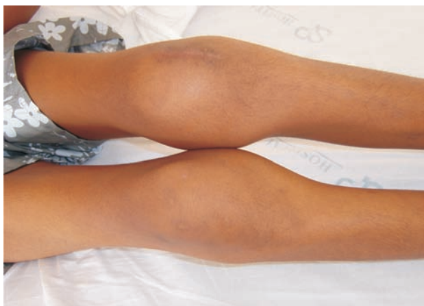
Figura 1 - Artrite deformante em joelhos.

Menino de 11 anos, etnia negra, previamente hígido, apresentou hiperemia no olho esquerdo há seis meses. Procurou oftalmologista que diagnosticou conjuntivite e prescreveu medicação tópica sem melhora. Evoluiu com febre de 38,5° C, perda de peso (8 kg) e aumento de volume e dor no joelho esquerdo. Foi internado em um hospital de atendimento secundário na Cidade de São Paulo. Exames laboratoriais na admissão: Hemoglobina (Hb) 10,9 g/dl, 6.900 glóbulos brancos/mm 3 (diferencial normal), 436.000 plaquetas/mm 3 e velocidade de hemossedimentação (VHS) de 117 mm na primeira hora. Foi feita uma hipótese diagnóstica de artrite séptica no joelho esquerdo, sendo realizada limpeza cirúrgica com biópsia de sinóvia e prescritos antibióticos de amplo espectro. A biópsia mostrou infiltrado inflamatório misto, proliferação vascular e depósitos de fibrina. Nesse período, apresentou artrite aditiva em joelho direito, tornozelos e articulação interfalangeana proximal do quinto quirodátilo da mão esquerda (Figura 1). Concomitantemente, apresentou dor, edema e hiperemia em pavilhão auricular direito, sem acometimento do lóbulo da orelha (Figura 2). Devido à persistência do quadro clínico após dois meses de internação sem esclarecimento de diagnóstico, o paciente foi encaminhado para o Hospital São Paulo.