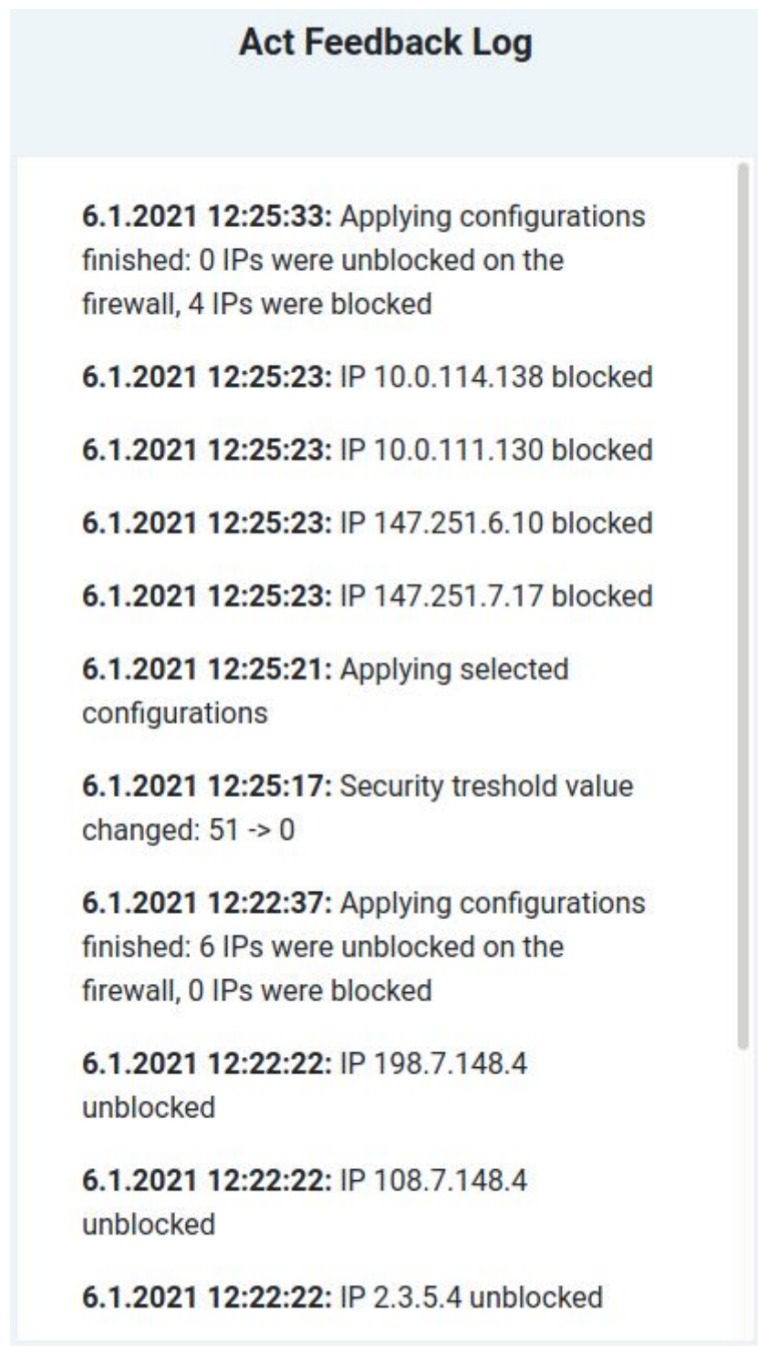
Obr. 6: Seznam aktuálních událostí ve fázi Act. Na obrázku je zachycena (zdola nahoru) aplikace konfigurací, změna Security treshold, a opětovná aplikace konfigurací s rozdílným výsledkem.

a případně chyby či varování, která tyto akce vyvolaly. Příklad obsahu panelu při pokusu o aplikaci konfigurací je zobrazen na obrázku 6. Zprávy zobrazované v panelu jsou z důvodu zachování přehlednosti filtrované a nezachycují kompletní podobu logu software fáze Act. Při řešení potíží s během software přesahujících běžné použití je doporučeno zkontrolovat log soubory software (viz podkapitola Troubleshooting).