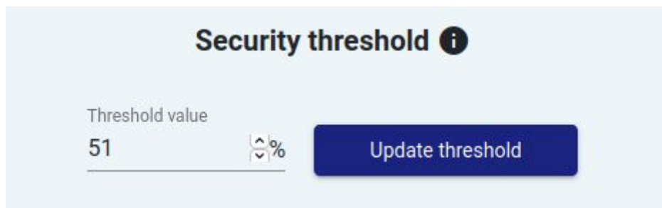
Obr. 5: Panel nastavení Security threshold.

Každý stroj nacházející se v síti chráněné systémem Crusoe dostává hodnocení ve třech sledovaných parametrech - míra ohrožení integrity, důvěrnosti, a dostupnosti. Více o těchto parametrech je možné zjistit v dokumentaci software fáze Decide. Software fáze Act pracuje se souhrnnou mírou ohrožení stroje, která je spočtena jako aritmetický průměr míry ohrožení integrity, důvěrnosti, a dostupnosti daného stroje. Dosahuje tedy hodnot z intervalu \langle 0, 100 \rangle .