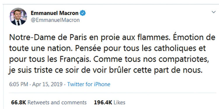
Figure 4. The first statement on Twitter by the President of the French Republic, Emmanuel Macron, during the fire of Notre-Dame Cathedral in Paris Rycina 4. Pierwsze oświadczenie Prezydenta Republiki Francuskiej Emmanuela Macron w serwisie Twitter podczas pożaru Katedry Notre Dame w Paryżu Source: Twitter social network [access. elect. 20 July 2020 https://twitter.com/EmmanuelMacron/status/1117851407644684288 [accessed: 20.07.2020]. Źródło: Serwis społecznościowy Twitter, https://twitter.com/EmmanuelMacron/status/1117851407644684288 [dostęp: 20.07.2020].