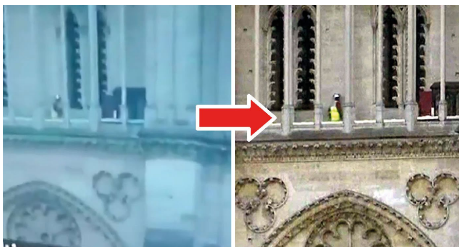
Figure 2. Low resolution (left) and high resolution (right) video of fake news during the fire of Notre-Dame Cathedral

Z kolei w serwisie Facebook popularność zyskał krótki film wideo charakteryzujący się niską rozdzielczością. Widać w nim było postać chodzącą po fasadzie budynku. Brak widocznych szczegółów na nagraniu nie pozwolił jednoznacznie określić, kim była osoba widoczna na filmie. Spowodowało to pojawienie się teorii spiskowych identyfikujących ową postać jako muzułmanina, o czym świadczyć miało – według części użytkowników – nakrycie głowy przypominające wyglądem turban. W przeciągu następnego kilku godzin media społecznościowe obiegł ten sam film, jednak w lepszej jakości. W rzeczywistości oryginalny materiał autorstwa amerykańskiej stacji telewizyjnej CNBC przedstawiał funkcjonariusza paryskiej straży pożarnej z hełmem na głowie podczas rozpoznania sytuacji. Szczegółowy obraz w niskiej oraz w wysokiej rozdzielczości przedstawia rycina 2 [20].