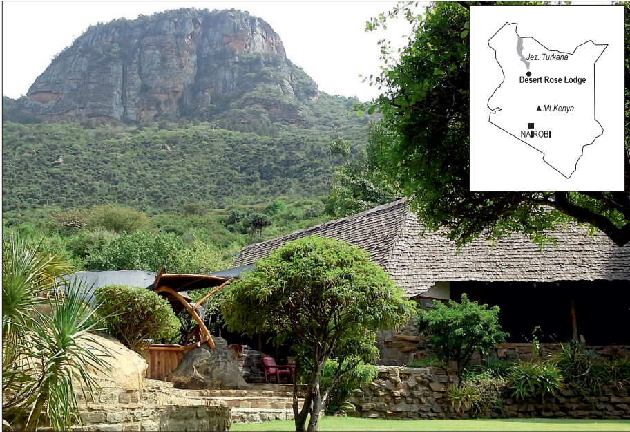
Ryc. 1. Lokalizacja obiektu noclegowego Desert Rose Lodge Fig. 1. Location of the Desert Rose Lodge