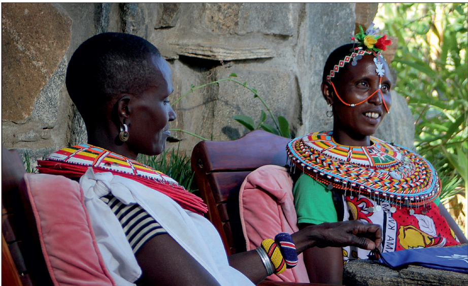
Ryc. 2. Pracownicy Desert Rose Lodge z miejscowej społeczności Samburu Fig. 2. Employees at the Desert Rose Lodge from the local Samburu community