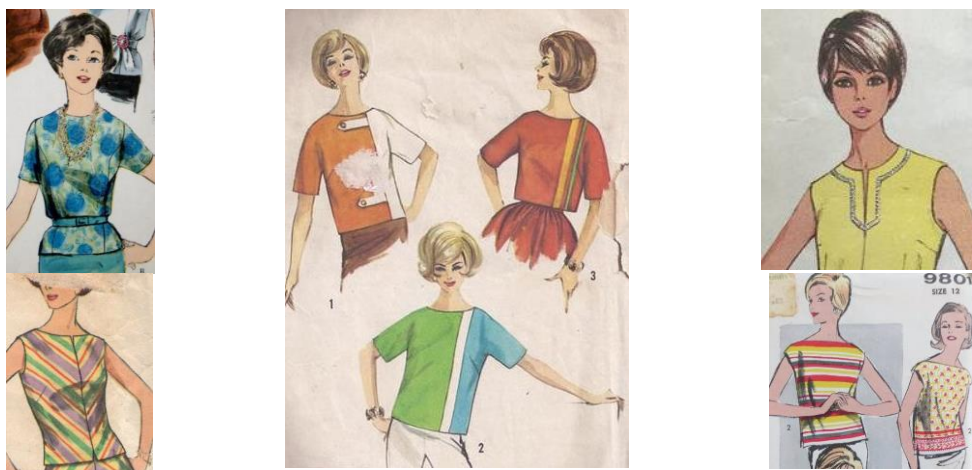
Іл. 4. Художньо-композиційні засоби виразності моделей блузок жіночих 1960-х років, ілюстрації з журналів VOGUE, McCall's, BUTTERICK, Simplicity Printed Pattern, Style, ADVANCE, MAUDELLA