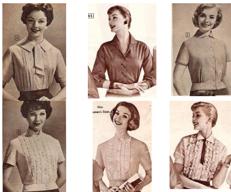
Іл. 1. Варіанти художньо-конструктивного рішення пілочок блузок жіночих 1950-х років, ілюстрації з каталогів Montgomery Wards [10]