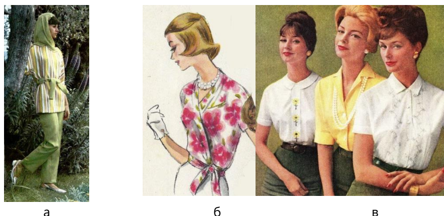
Іл. 5. Блузки жіночі другої половини 1960-х років: а – комплект блузка і брюки, нав'яні ідеєю єднання з природою, ілюстрація з журналу VOGUE; б і в – рослинні мотиви в моделях святкових блузок і для офісу, ілюстрації з журналів VOGUE Patterns і Ship & Shore.

Однак запит на сучасні блузки з елементами тих років є значно більшим, а отже і потреба у їх детальному аналізі художніх і композиційно-конструктивних елементів. Тому, на основі проведеного аналізу розроблено базу даних конструктивних і декоративних елементів блузок 1950-х і 1960-х років, яка може бути творчим джерелом для проектування колекцій нових моделей одягу.