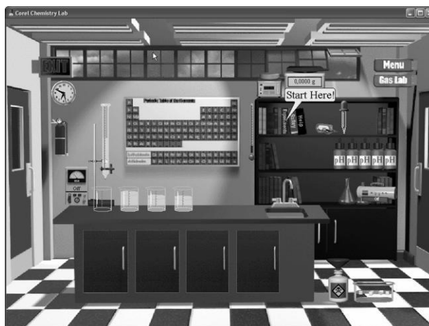
Рис.1. – Головне вікно програми Corel Chemlab 1.0

Головне вікно програми Chemlab 1.0 є графічним малюнком, де зображено частину хімічної лабораторії з робочим столом, шафою з реактивами та хімічним устаткуванням, що надає можливість студенту начебто відчувати себе в хімічній лабораторії (рис.1).