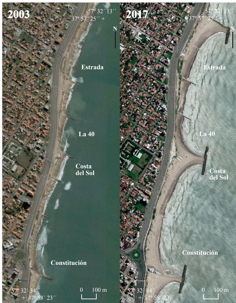
Figura 2. Evolución temporal del área de estudio. Imágenes satelitales del área de los años 2003 y 2017 (Google Earth). Fuente: elaborado por Merlotto y Verón.