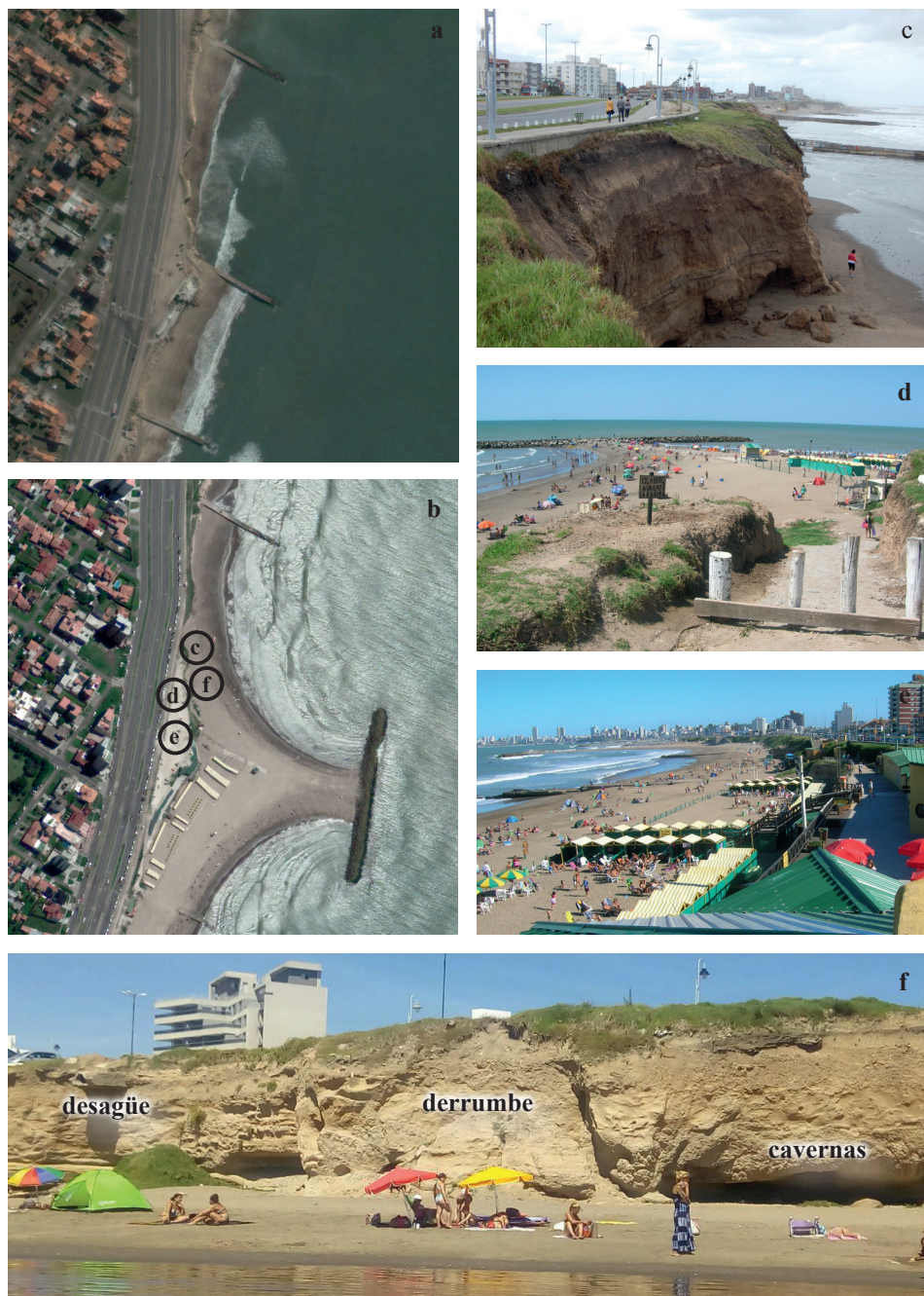
Figura 4. Imagen satelital (Google Earth) de las playas La 40 y Costa del Sol a) 07/05/2003 y b) 27/02/2017. c) Vista del paseo costero y pie de acantilado en La 40 (07/02/2017). d) Acceso a playa La 40 y e) Playa Costa del Sol (10/01/2018). f) Playa La 40 desde el mar (10/01/2018).