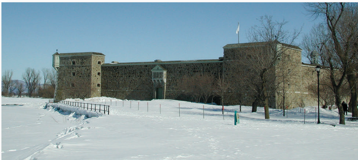
▲ Au bord de la rivière Richelieu, le fort Chambly constituait un maillon principal de la ligne de défense contre les Iroquois et les Anglais au sud de la colonie. Préservé, remanié et consolidé par les Britanniques après 1760, il conserve le même rôle face à la menace que représente la jeune république états-unienne.