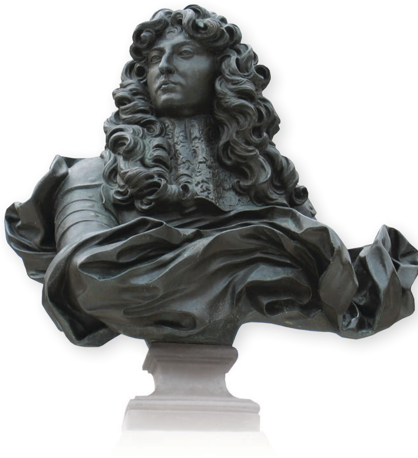
▲ Copie d'une sculpture conservée à Versailles et, surtout, symbole du pouvoir de la royauté en Nouvelle-France, le buste de Louis XIV trône au centre de Place-Royale, à Québec, depuis la fin des années 1940.

Pour ce faire, la royauté agit d'abord par mandats confiés à des tiers, les compagnies commerciales, avant de prendre directement à sa charge la conduite des affaires coloniales en 1663. Dès lors, la Nouvelle-France sera dotée d'offices coloniaux reproduisant la structure administrative des provinces du royaume, avec ses gouverneur, intendant, grand voyer, magistrats et autres charges publiques visant la saine administration du territoire, l'exploitation de ses ressources au bénéfice du roi – et plus largement des intérêts économiques de la métropole – et le maintien de l'ordre comme de la justice. Source de richesses, le territoire nord-américain devient rapidement un enjeu dans les luttes opposant les Couronnes européennes. Celles-ci rivalisent d'ingéniosité dans leurs relations avec les nations amérindiennes, domaine où la France connaît globalement davantage de succès que l'Angleterre ou l'Espagne, en entretenant des alliances qui lui permettront d'étendre son influence – et son commerce – sur les deux tiers du continent avant de céder devant les forces conjuguées des Britanniques, qui dominaient les mers, et de leurs