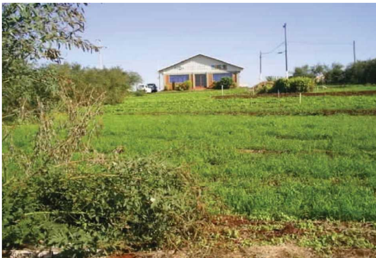
Figura 01: Área de Produção Orgânica nos primeiros anos de desenvolvimento.

Já para o evento de 2006, houve a incorporação de mais 02 instituições parceiras na condução da área, o Instituto Agrônomo do Paraná (IAPAR), e a Itaipu Binacional. Foram cultivadas parcelas, com várias espécies tradicionais na região, como: milho, soja, feijão, arroz; culturas potenciais: feijão azuki, araruta, cará, cúrcuma, gengibre, inhame, gergelim, amendoim e batata doce; e culturas de cobertura e adubação verde: Crotalaria juncea , capim moha, feijão de porco e mucuna anã, conforme disposição na Figura 02.