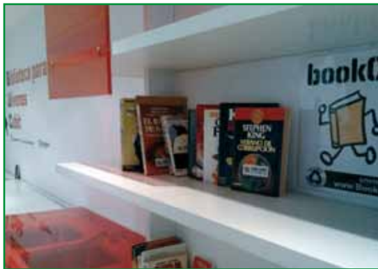
Zona BC en La Azucarera

Como mágicos son los lugares elegidos para las liberaciones. Determinado árbol con un agujero en la base en la calle Consejo de Ciento de Barcelona, o un león lector que vive en la madrileña Plaza de Oriente. Se dice que alguien liberó el libro Don Juan Tenorio de José Zorrilla frente a la tumba del poeta en el Cementerio del Carmen en Valladolid. En Zaragoza, Casas de Juventud, biblioteca, bares e incluso alguna farmacia, han habilitado zonas oficiales de liberación. La Biblioteca para Jóvenes Cubit (BJC), ubicada en un edificio tan mágico como la antigua Azucarera (c/ Mas de las Matas, 20), se inició en el mundo de los bookcrossers o beceros de la ciudad en abril de 2011, con una zona BC localizada en el espacio denominado como “Chillout” en la rehabilitada vieja fábrica de azúcar.