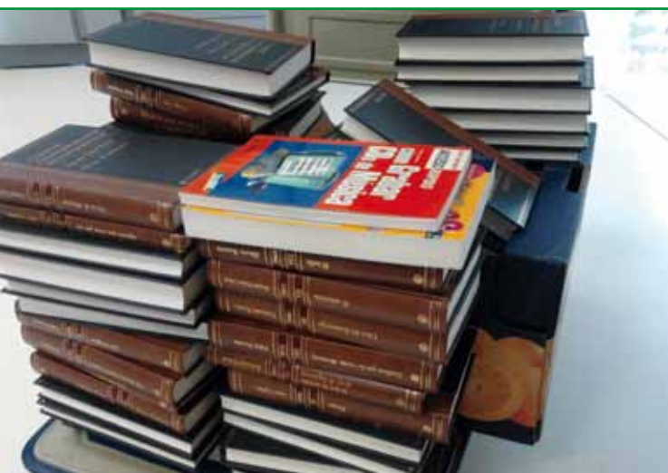
Imágenes de donativos recibidos en la BJC.

gráfico había de estar muy organizada y medida. Comenzamos así un proceso de selección de donativos clasificándolos por centros de interés, priorizando formatos y temas según la programación de la biblioteca, y temporalizando su disposición al usuario a lo largo de todo el año.