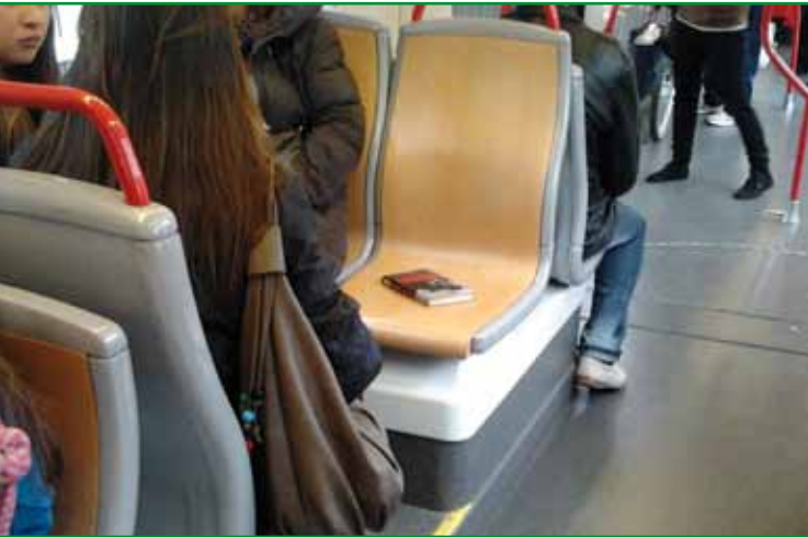
Interior de autobús y tranvía de Zaragoza