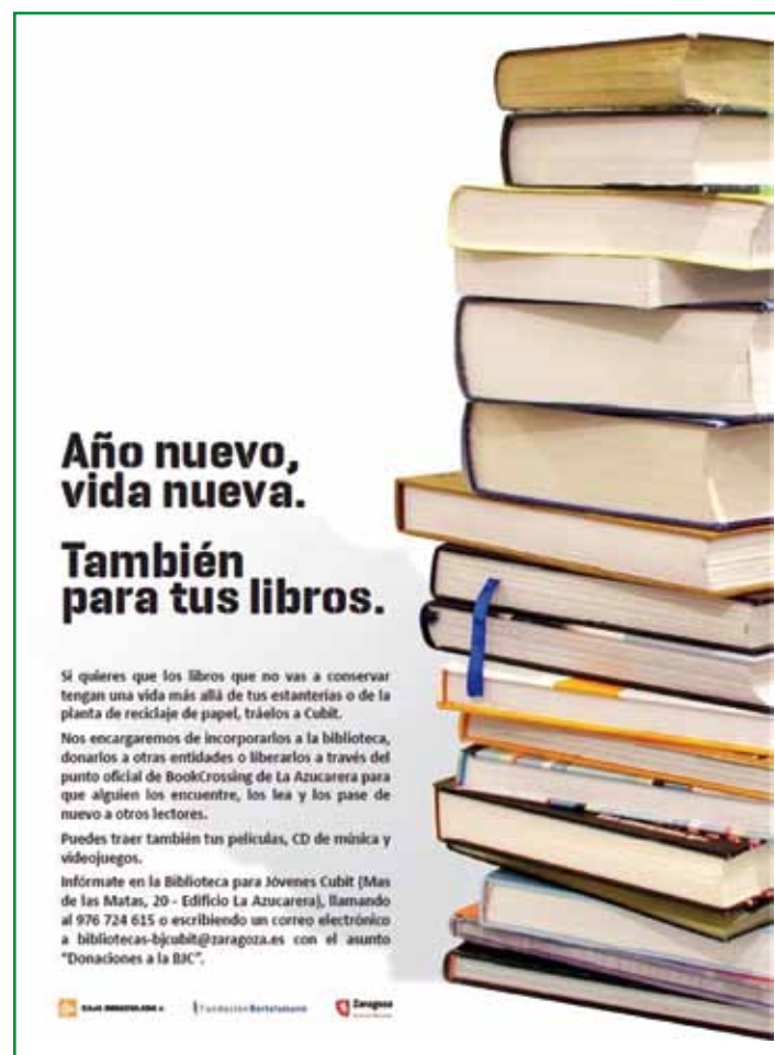
Cartelería campaña de solicitud de donativos, enero de 2012.

Así que lo primero que debemos hacer desde Cubit es transmitir nuestro agradecimiento a todas las