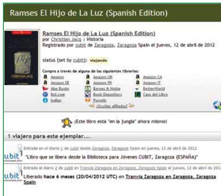
Datos del libro liberado por la BJC que “firma” la carta recibida a finales de octubre de 2012.

en una maleta y en una hora estaba en la mesita de una habitación de estar, en un pueblo de la Comarca del Campo de Cariñena, donde transcurrió todo el santo verano. En el mes de septiembre se apagaron las luces de la casita, se cerraron las ventanas de la habitación donde placía tranquilamente y cesaron los ruidos totalmente. Todo transcurrió en silencio, hasta que pasado un mes volvió a oírse el trasego de los tractores con la vendimia; apareció la luz por las ven-