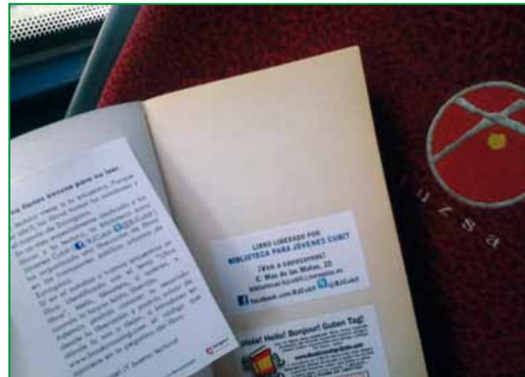
Interior del libro portador del virus del BookCrossing

Una vez seleccionados e identificados, los portadores siguieron un estricto plan de instrucción: en las