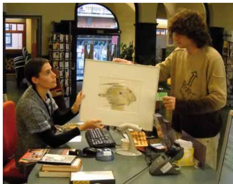
Préstamo de obra de arte.

El servicio de exposición se inicia con la cesión de la obra por parte del artista. El artista firma un contrato de cesión que es aprobado por Junta de Gobierno local. Esta obra es catalogada, fo-