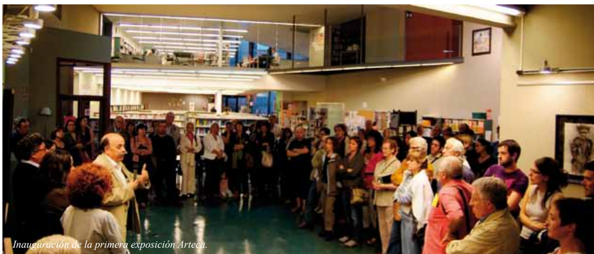
Inauguración de la primera exposición Arteca.

tografiada y registrada. Se coloca en exposición junto al resto del fondo artístico. El artista que cede la obra entra a formar parte de los sorteos de fechas de exposición (hasta el momento quincenales). Cada artista puede exponer la obra que él cree conveniente.