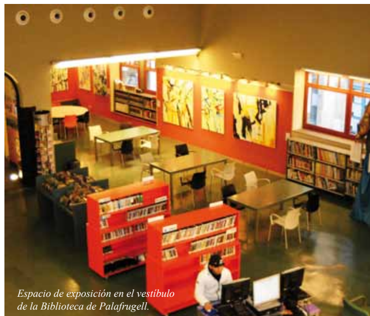
Espacio de exposición en el vestíbulo de la Biblioteca de Palafrugell.

Al mismo tiempo la biblioteca consigue generar encuentros con los artistas. Encuentros físicos con pequeñas inauguraciones de las exposiciones (los sábados por la tarde) y encuentros virtuales con la obtención de un catálogo de obras y artistas para la posteridad.