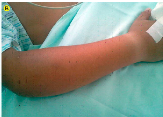
Figura 3B - Progressão proximal do edema ao antebraço