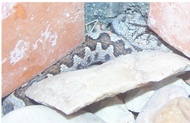
Figura 2 – Fotografia da víbora captada por familiar do doente imediatamente após a mordedura

monitorização envolve: avaliação contínua dos sinais vitais, traçado electrocardiográfico, débito urinário e exame físico seriado, orientado para as complicações sistémicas. 9,14,15 A avaliação analítica repete-se a cada 8 a 12 h (6 horas no caso de coagulopatia) e após cada infusão de SAO. 9,14 Nestes casos, um mínimo 24 horas de observação é mandatória podendo a alta ser protelada perante critérios de mau prognóstico. 9,11,19