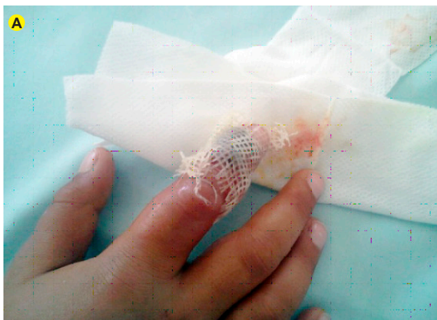
Figura 3A - Flictena e edema do 2º dedo da mão direita

A alta deve ocorrer na ausência clínica e analítica de progressão do envenenamento (por 24 h) com controlo analgésico adequado. Sugere-se limitação da actividade física e vigilância por 72 horas. 15,27