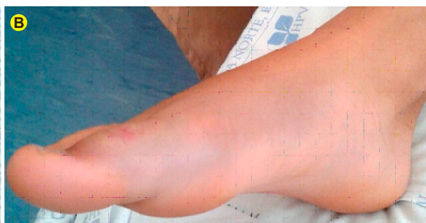
Figura 4B - Progressão proximal do edema ao pé direito