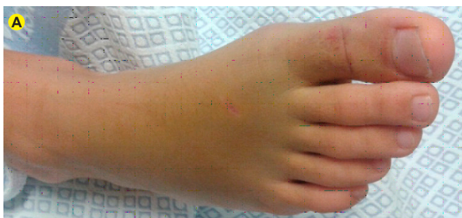
Figura 4A - Ferida punctiforme e edema do 1º dedo do pé direito