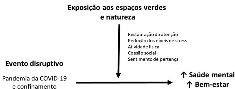
Fig. 1 – Mecanismos pelos quais o contacto com espaços verdes e natureza pode influenciar a saúde mental durante o confinamento causado pela COVID-19.

Vários mecanismos, esquematizados na figura 1, podem explicar o efeito salutogénico dos espaços verdes na saúde mental das populações, destacando-se dois importantes modelos teóricos: a teoria da restauração da atenção (do inglês, Attention Restoration Theory ) e a teoria da recuperação do stress ( Stress Recovery Theory ). Segundo a teoria da restauração da atenção, a utilização e contemplação de espaços naturais diminui a fadiga mental associada aos estímulos constantes do quotidiano (ex.: ruído, trânsito, aglomeração), melhorando assim a concentração e atenção (Kaplan, 1995). Já a teoria da recuperação do stress defende que o contato com os espaços naturais é capaz de reduzir as respostas psicofisiológicas ao stress (Ulrich, 1983). Por outras palavras, o contacto com espaços verdes pode ajudar a amortecer o impacto de eventos disruptivos e de adversidades. Veja-se o exemplo de um estudo holandês que constatou que o impacto de eventos stressantes (ex.: desemprego, crise financeira, violência) no estado de saúde geral é menor nos indivíduos com uma maior quantidade de espaço verde no entorno da sua residência do que aqueles com menor quantidade de espaço verde residencial (van den Berg, Maas, Verheij, & Groenewegen, 2010). Ora, o confinamento e a vivência de uma pandemia são, sem dúvida, eventos disruptivos e adversos.