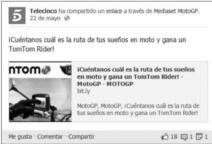
Imagen 3. La televisión española Telecinco anima a los internautas a compartir sus experiencias en Facebook