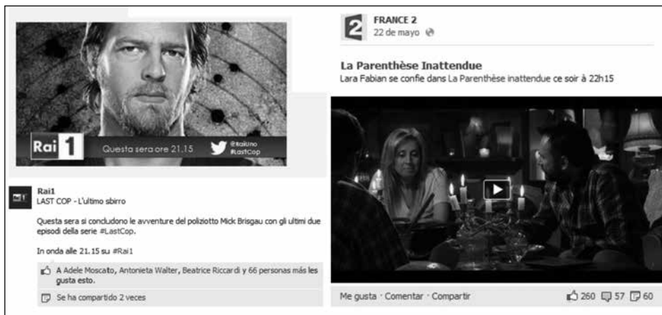
Imagen 2. Usos promocionales del Facebook de la televisión italiana Rai1 y la francesa France2

Si examinamos las cifras por plataformas, tanto en Facebook como en Twitter también predomina el uso informativo en todos los tipos de medios con la única excepción de las televisiones europeas en Facebook (Imagen 2). Aquí, el uso es claramente promocional (ver Tabla V), correspondiendo el 60% de sus mensajes a esta función frente al 35% que pertenece a la variante informativa.