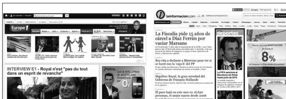
Imagen 1. Captura de pantalla de la radio francesa Europe 1 y el "pure player" español Lainformación.com

Respecto a la situación de los iconos de acceso a las redes sociales en la página inicial del medio o "home", la opción mayoritaria es la parte superior, cerca de la cabecera (Imagen 1), lo que garantiza la máxima visibilidad de los mismos a los usuarios. Otra posibilidad bastante aceptada pasa por colocarlos en los laterales, a diferencia de lo que ocurre con la parte inferior, que es la fórmula menos explorada por los medios estudiados. Esto es así con independencia del tipo de soporte.