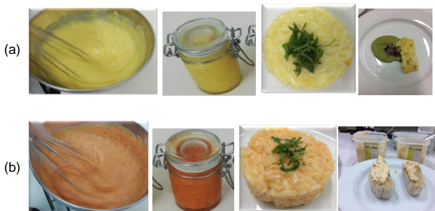
Figura 3 - Creme de barrar de pimento amarelo (a) e vermelho (b); da esquerda para a direita: fim da produção, embalagem e food pairing .

Na figura 3 são apresentados os protótipos finais, da esquerda para a direita: fim da produção, embalagem e aplicações gastronómicas (RAM e AVm respectivamente).