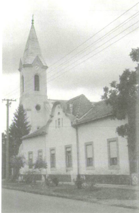
5. A római katolikus templom és plébánia.