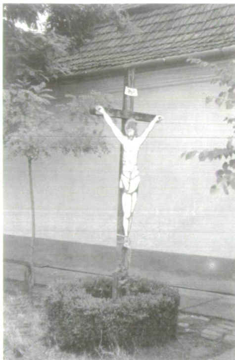
7. Bádó-Krisztus a Nagy utca sarkán.