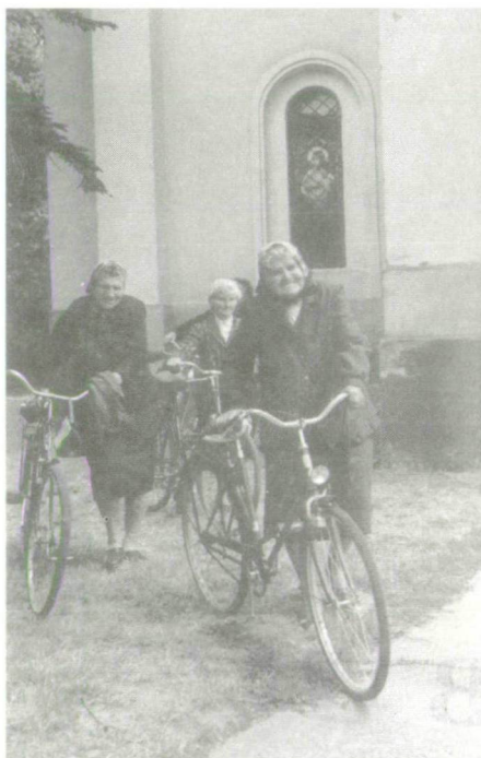
6. Vasárnap délelőtt: miséről hazainduló asszonyok 2000 őszén. Juhász Antal felvétele.