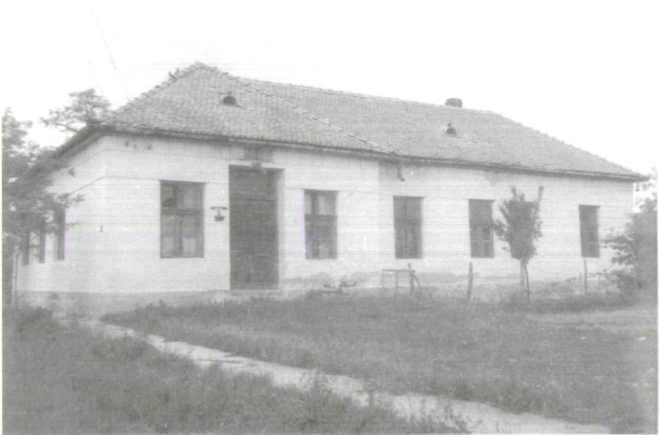
4. A vilmatéri öregiskola kibővített épülete.