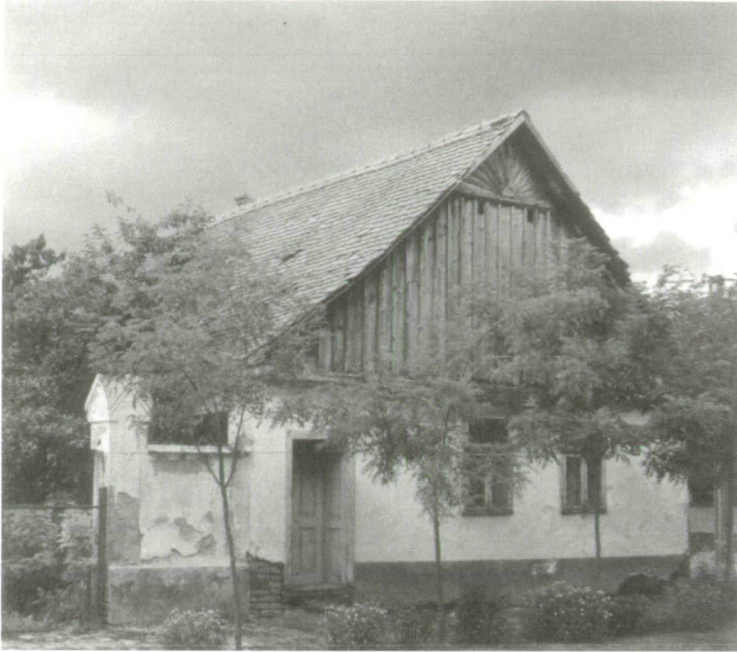
1. Hagymányos jellegű deszka oromzatú ház, az oromzat csúcsán fél napsugárdísszel.