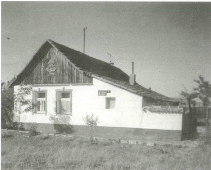
2. Nyeregtető, deszka oromzatú ház, toldott ereszzel.