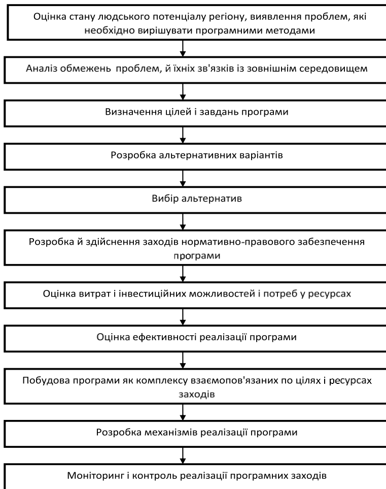
Рис. 1. Рекомендована схема щодо регіонального управління розвитком людського капіталу (розроблено автором)

Для розгляду людського капіталу як ресурсу економічного розвитку регіону запропоновано використовувати поняття «людський капітал регіону».