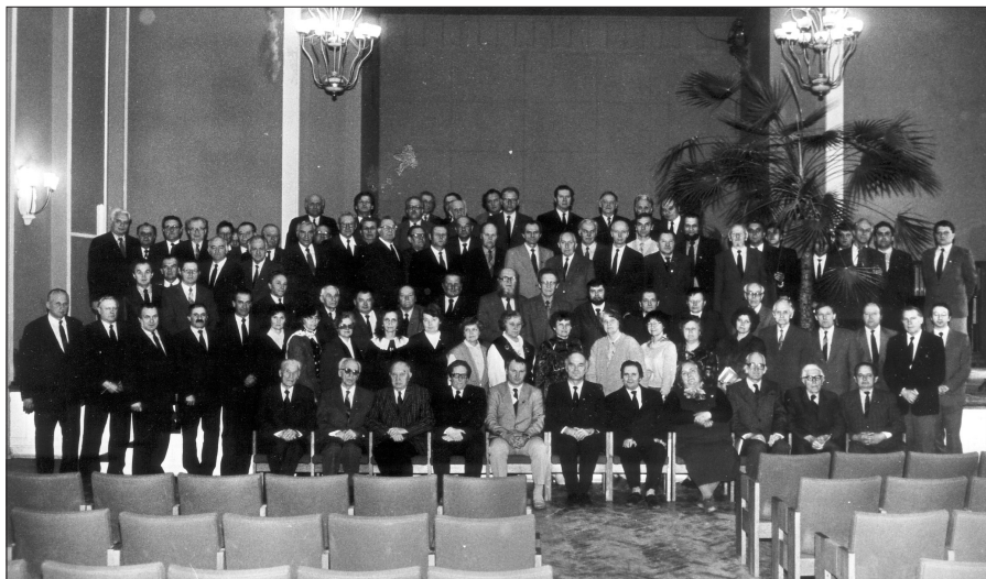
APSi üldkogu Riia mäel