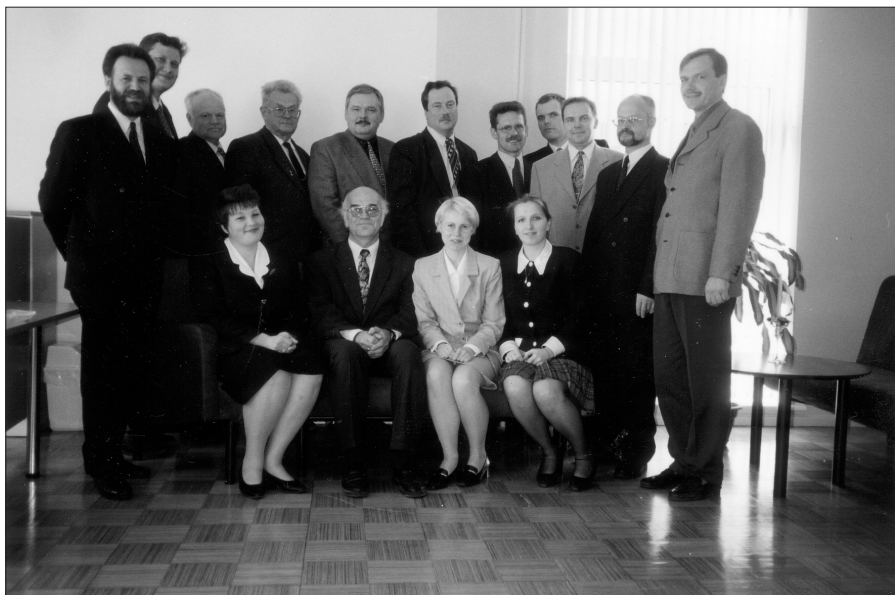
Eesti Põllumajandus-Kaubanduskoja esimese nõukogu ja juhatuse koosseis 1997. a